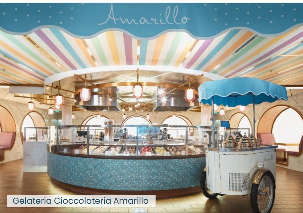
Gelateria Cioccolateria Amarillo