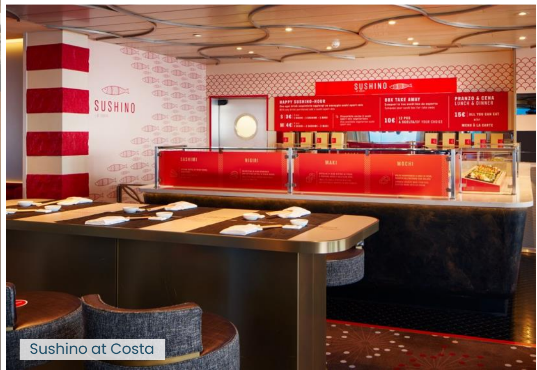
Sushino at Costa