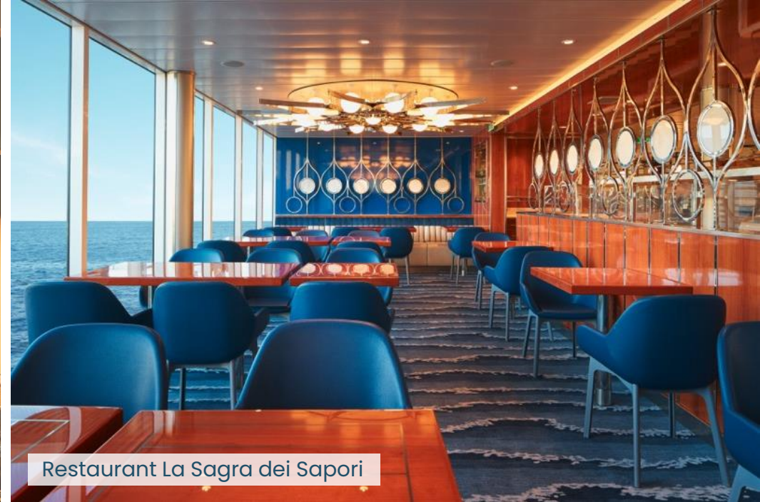
Restaurant La Sagra dei Sapori