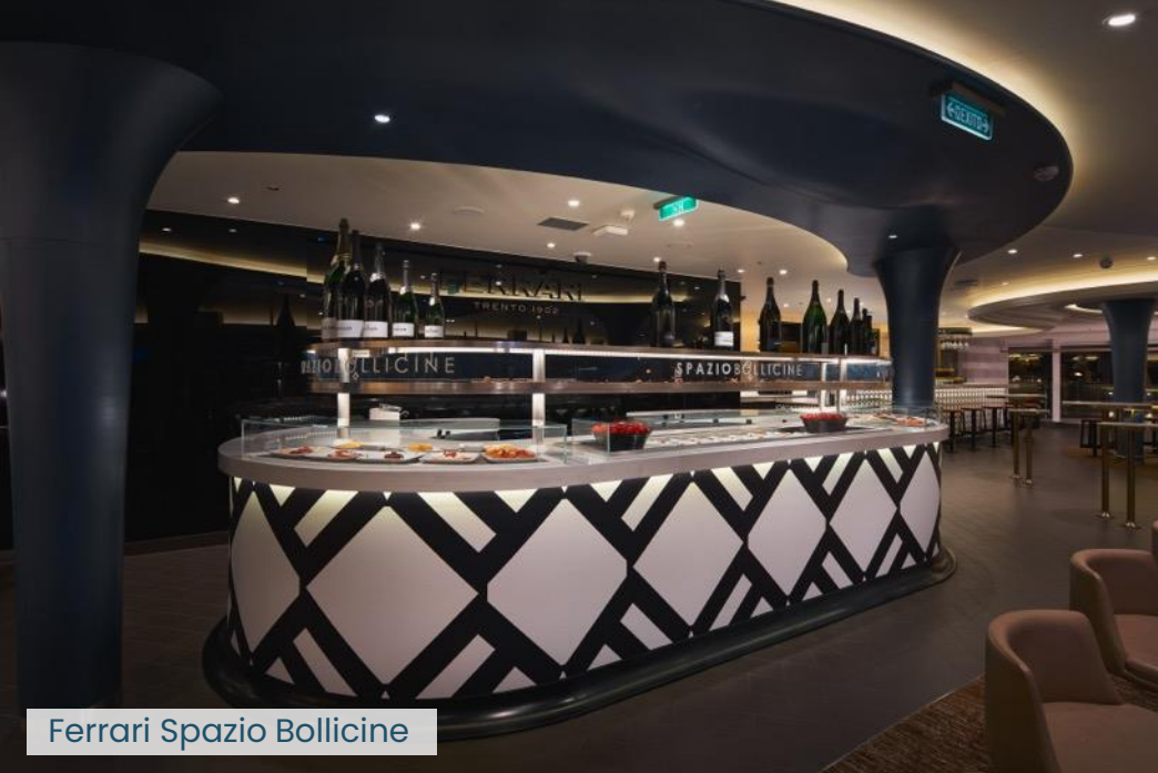
Ferrari Spazio Bollicine