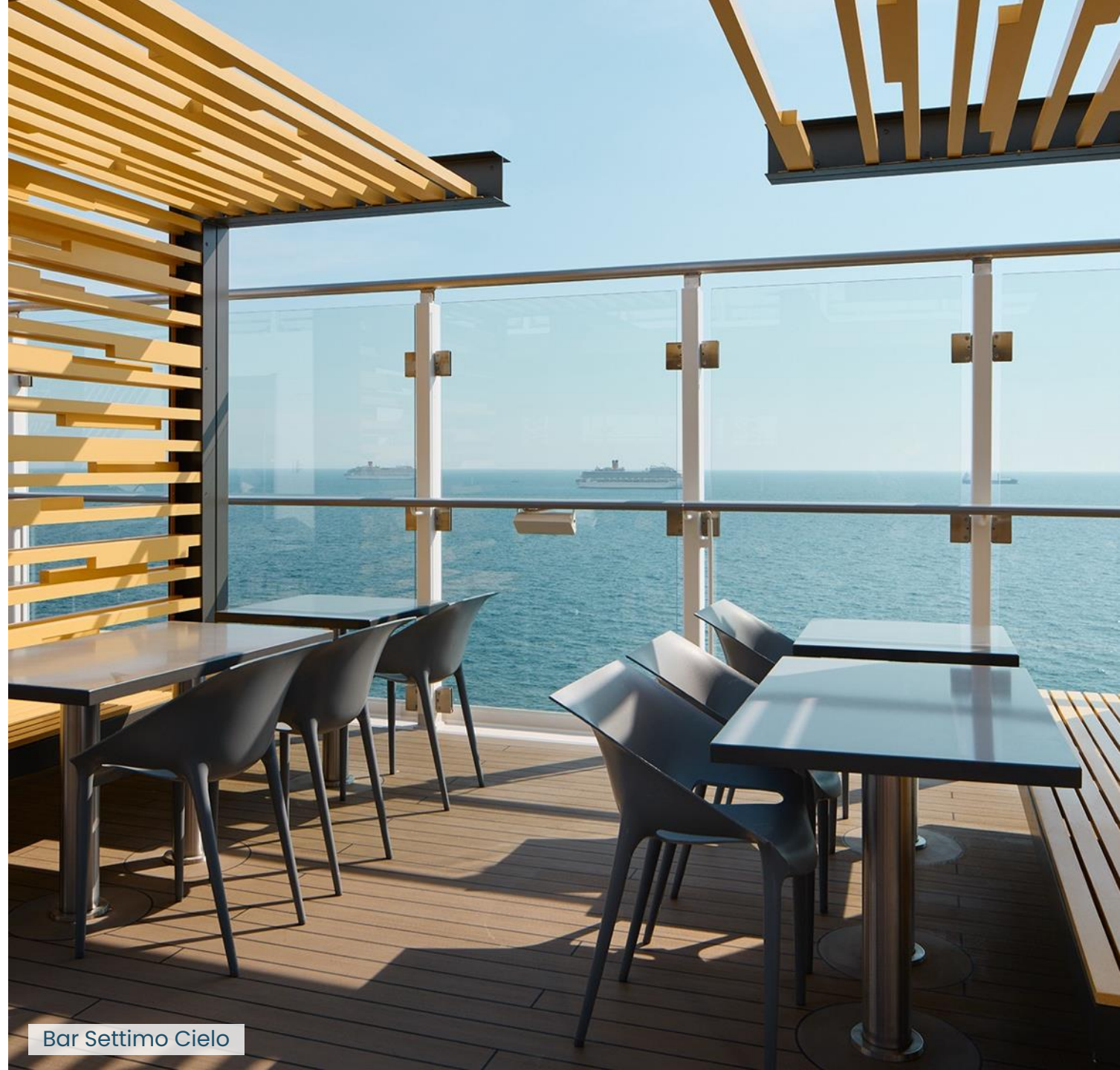
Bar Settimo Cielo