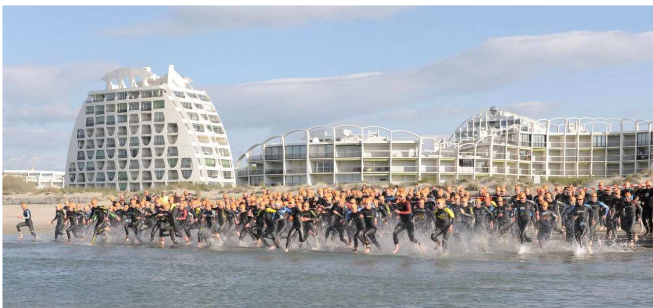
Photo SwimRun la Grande Motte

Capitainerie du Port : Tél. 04.67.56.50.06. Site internet du Port de La Grande Motte : www.portdelagrandemotte.fr