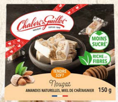
Nougat tendre moins sucré* au miel de châtaigner 150 g : Réf. 40010520