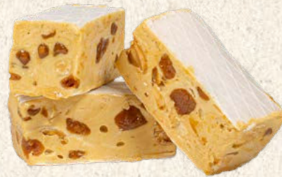
Nougat tendre caramel d'Isigny beurre salé 1 kg : Réf. 30012170