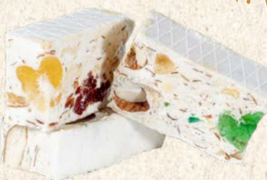
Nougat tendre cerise bigarreau 1 kg : Réf. 30012190