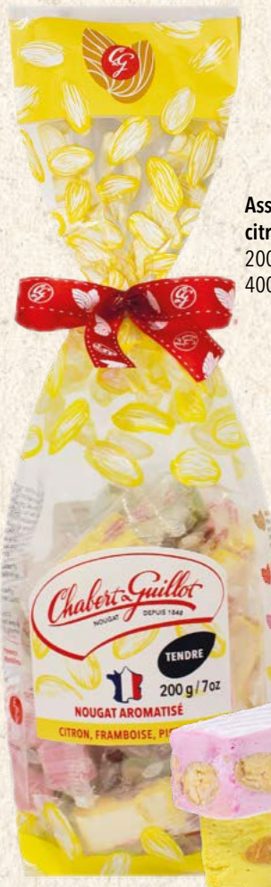
Assortiment de nougat tendre citron, framboise, pistache 200 g : Réf. 40009140 400 g : Réf. 40009150