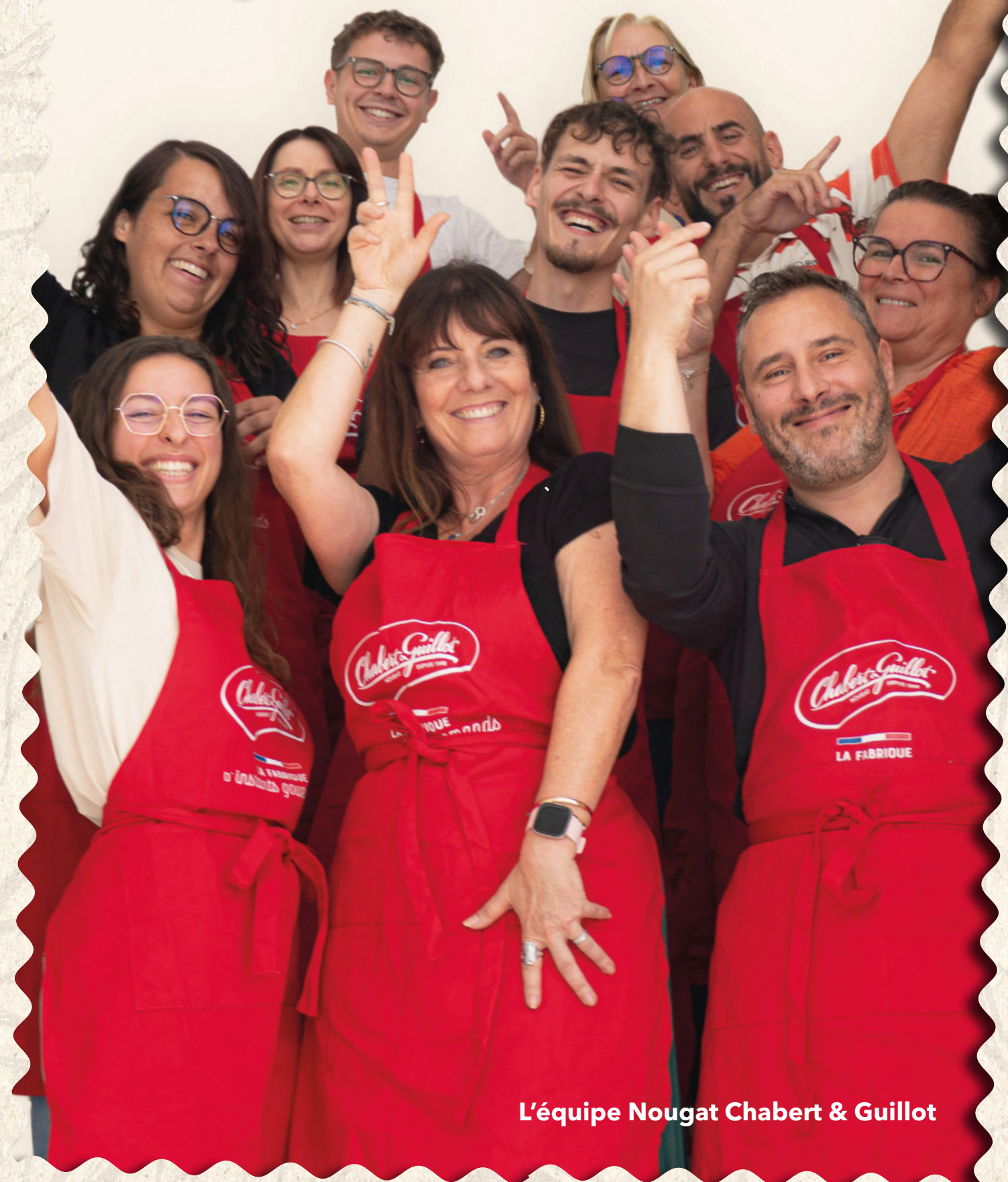
L'équipe Nougat Chabert & Guillot