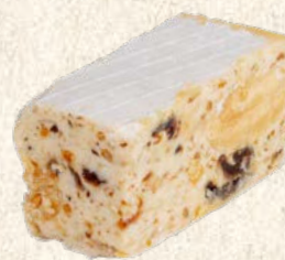
Nougat figue x5