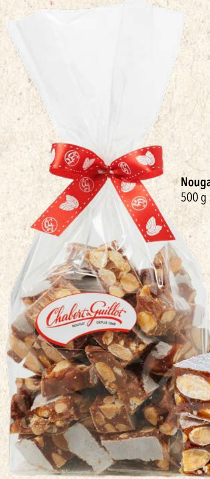
Nougat dur noir 500 g : Réf. 30055000