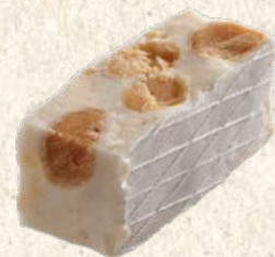
Nougat de Montélimar IGP tendre x4