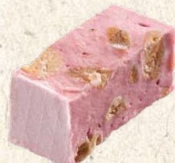
Nougat framboise x4