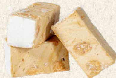
Nougat tendre café 1 kg : Réf. 30012240