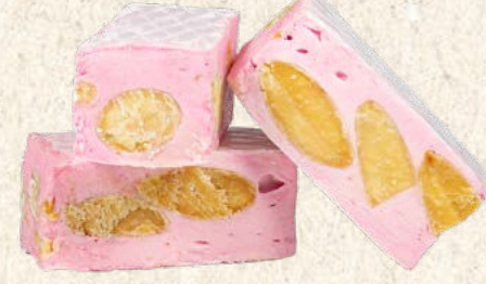
Nougat tendre framboise 1 kg : Réf. 30012210