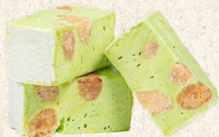
Nougat tendre pistache 1 kg : Réf. 30012220