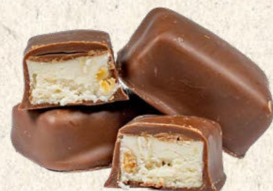
Nougat de Montélimar IGP enrobé chocolat lait-orange x3