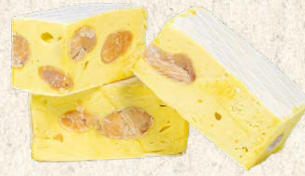
Nougat tendre citron 1 kg : Réf. 30012230