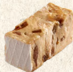
Nougat caramel au beurre salé x4