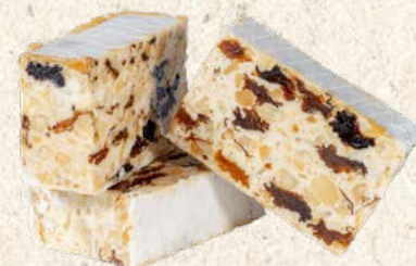
Nougat tendre rhum-raisin 1 kg : Réf. 30012180