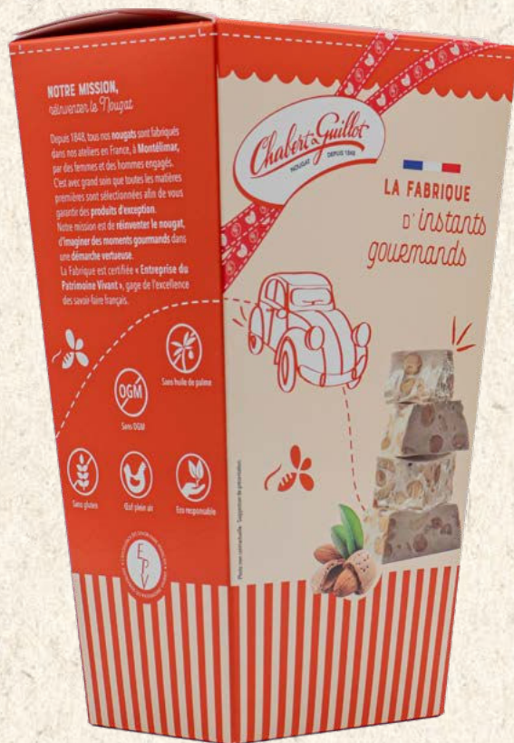
BOITE PARTAGE (vide) 824 ml (environ 23 nougats de 10 g): Réf. 40012110