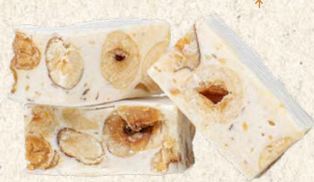
Nougat tendre amandes caramélisées et noisettes 1 kg : Réf. 30012200