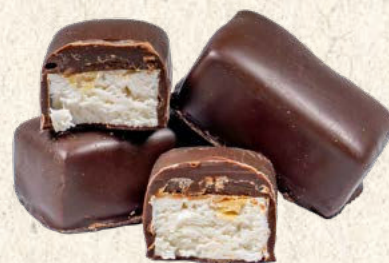
Nougat de Montélimar IGP enrobé chocolat noir x3