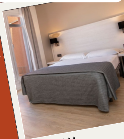
L'hôtel *** Porcel Ganivet

L'hôtel Porcel Ganivet est idéalement situé à Madrid, à 150 mètres de la station de métro Puerta de Toledo et à 10 minutes à pied de la Plaza Mayor, 5 minutes à pied du marché du Rastro. Il propose des chambres climatisées avec coffre-fort et une connexion Wi-Fi gratuite. Un petit-déjeuner buffet est servi à l'hôtel. Un bar et un snack-bar sont également disponibles.