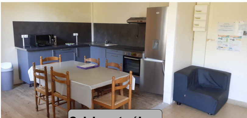
Cuisine et séjour