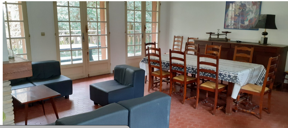
Séjour avec 2 terrasses