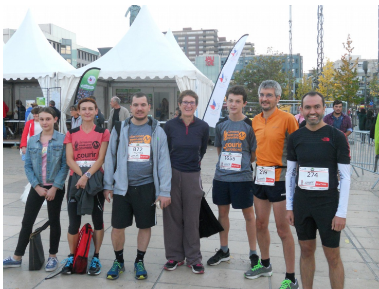
Une partie de l'équipe de l'ASCEE 63

Une semaine plus tard, nous étions 12 à chausser ou rechausser nos baskets pour la course « Courir à Clermont », 5 ou 10 kms dans les rues de Clermont un samedi soir à l'heure de sortie des magasins. Pour l'occasion, les équipes étaient rajeunies avec un minime qui faisait le 5 km pour la première fois et un cadet le 10km. Cette course s'est déroulée dans une ambiance très sympa et par un temps idéal avec beaucoup de monde tout le long du parcours pour nous encourager. Au classement du challenge Entreprises, l'équipe termine à une superbe 4ème place sur 48 équipes engagées et de super performances individuelles de chacun. Bravo à tous nos coureurs de s'être donné à fond.