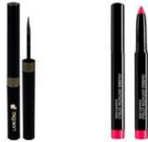
051 - JADE