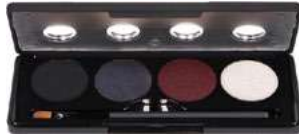
SMOKEY EYE GLAMOUR