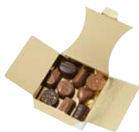
RÉFÉRENCE : 214914 Assortiment de 8 recettes Noir et Lait Ballotin de 18 chocolats