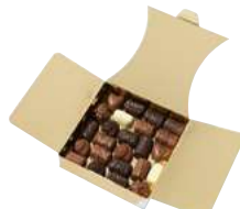
RÉFÉRENCE : 214916 Assortiment de 12 recettes Noir, Lait et Blanc Ballotin de 48 chocolats