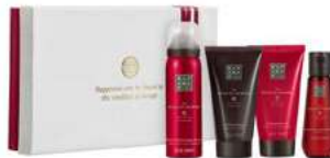
RITUAL OF AYURVEDA - 4 PRODUITS