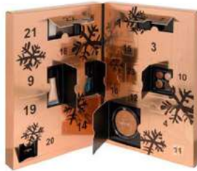
CALENDRIER DE L'AVANT