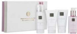
RITUAL OF SAKURA - 4 PRODUITS