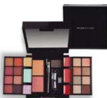
MALETTE MAQUILLAGE - PETIT FORMAT