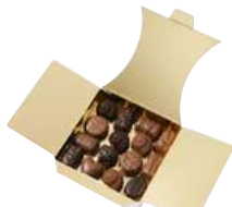
RÉFÉRENCE : 214915 Assortiment de 10 recettes Noir et Lait Ballotin de 30 chocolats