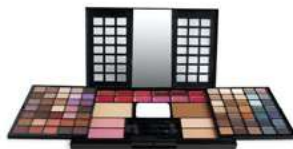
MALETTE MAQUILLAGE - GRAND FORMAT