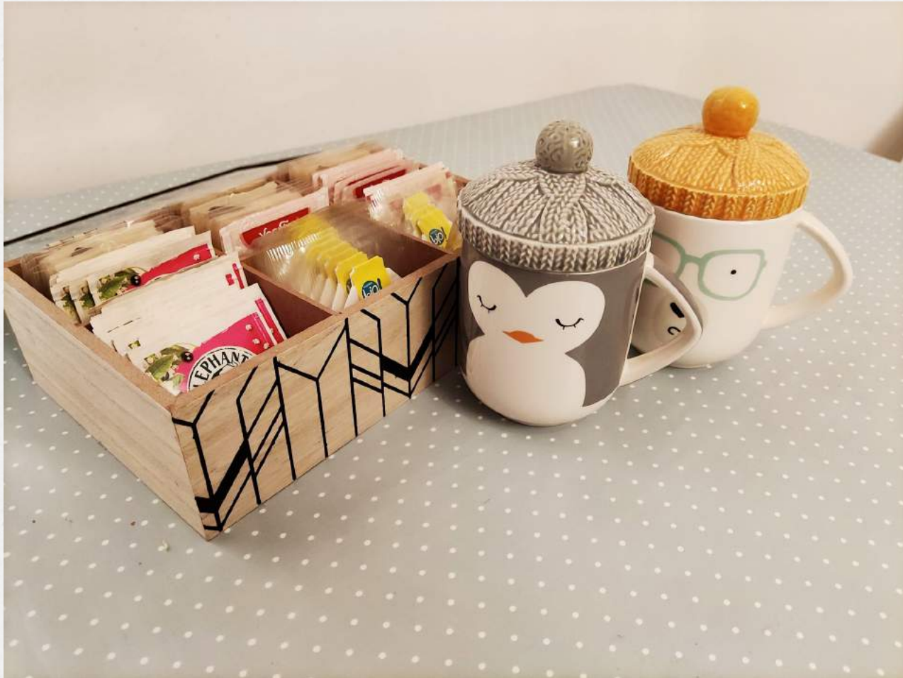
3. un objet réconfortant – duo de tasses