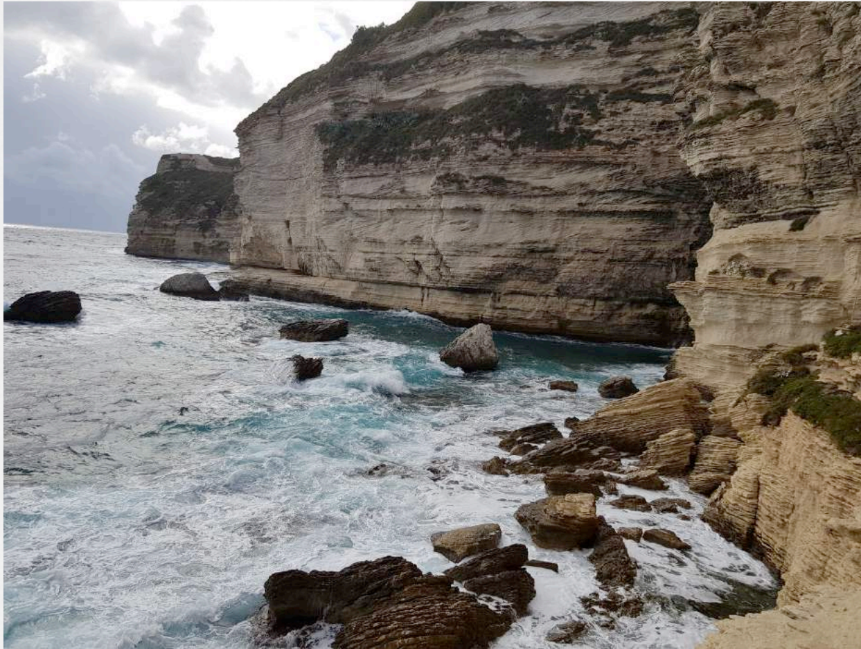
12. une scène aquatique – Falaises de Bonifacio, Corse, septembre 2020