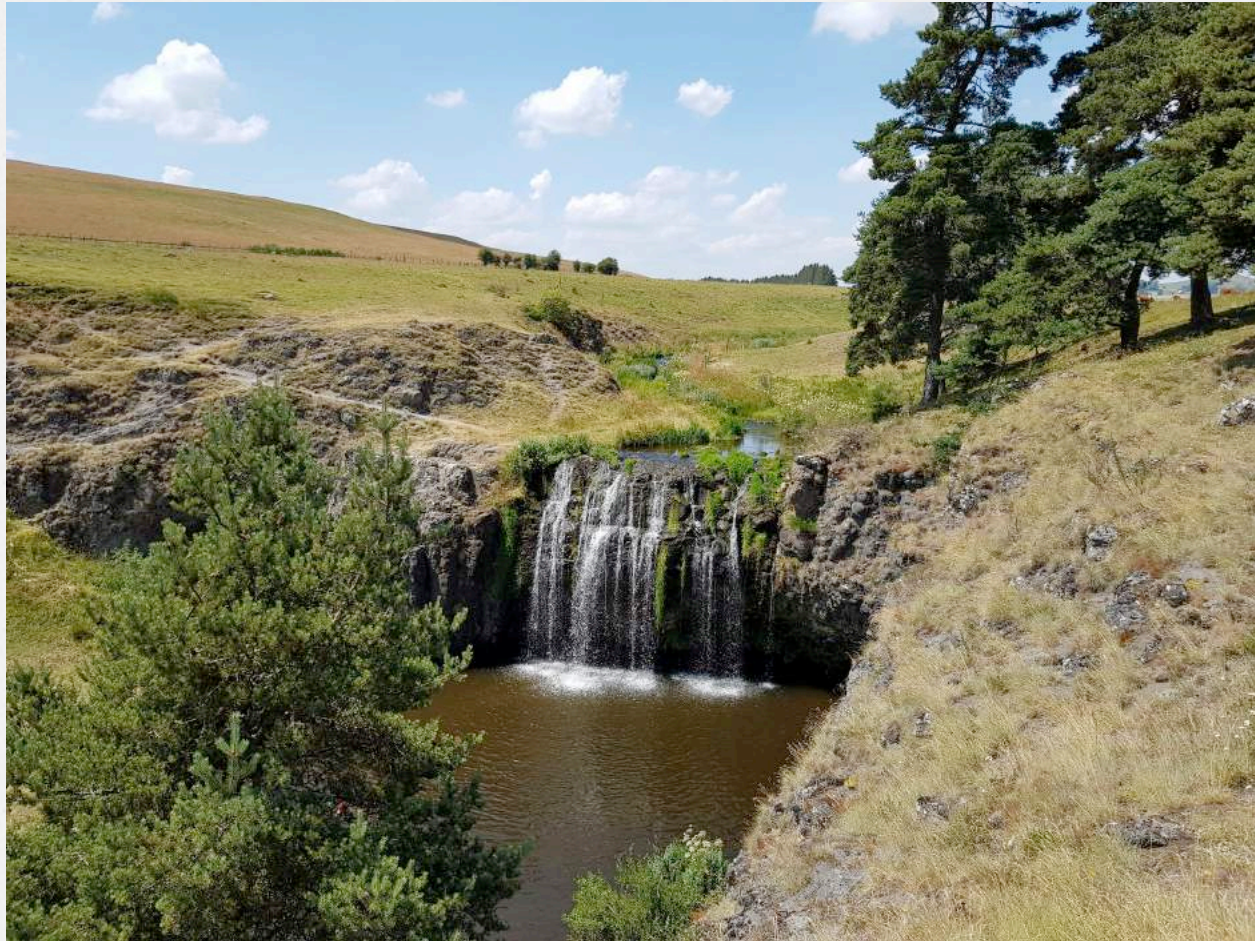
11. une scène champêtre à la lumière du jour Cascade des Veyrines, Cantal, juillet 2020