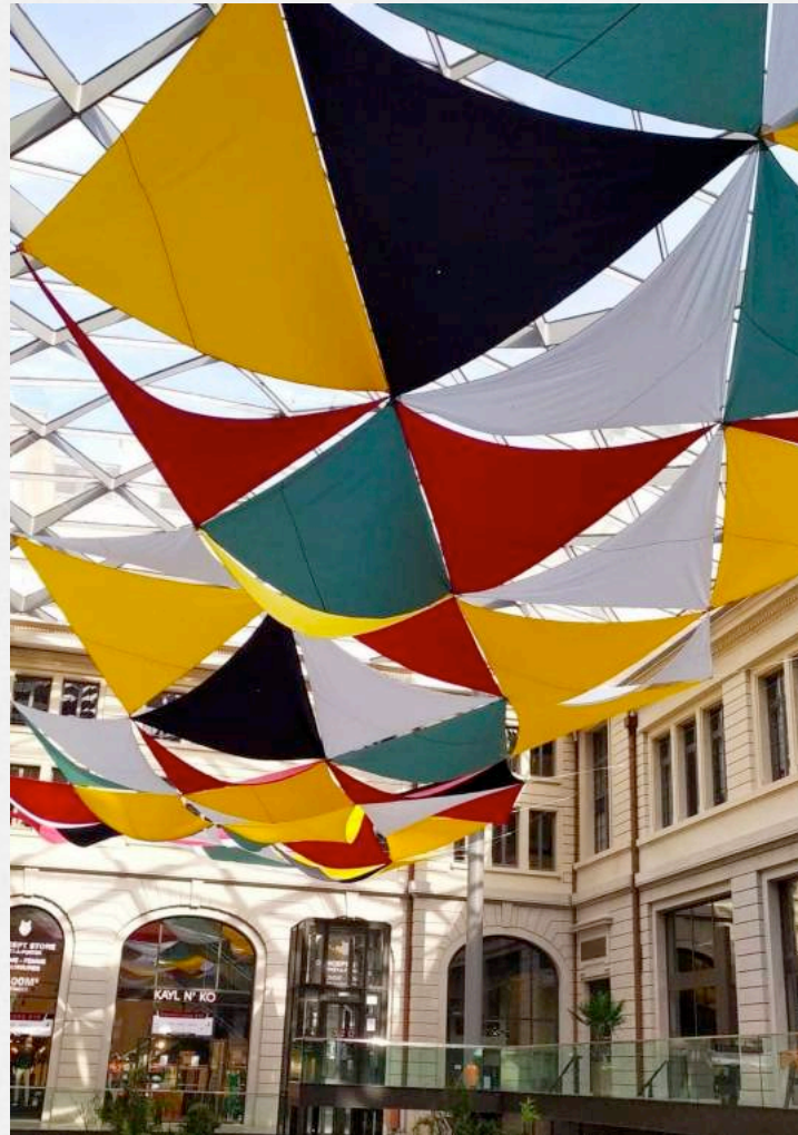
14. un instant décalé à proximité d'un monument du département du Rhône connu – Lyon, Grand Hôtel-Dieu, été 2020