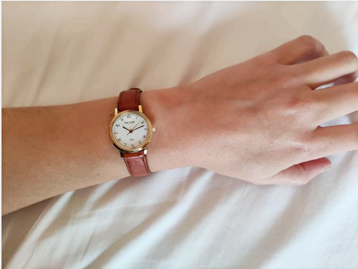
4. un objet vintage – montre française