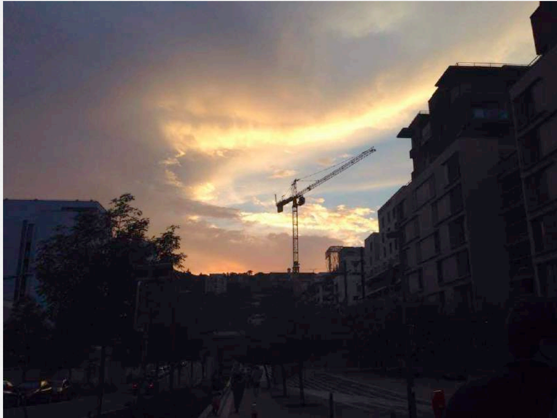
13. un coucher de soleil – Lyon, Confluence, juillet 2020