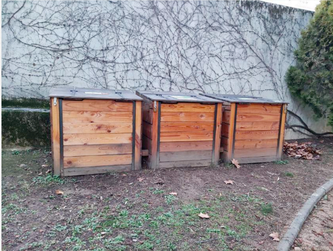
2. un objet « écolo » - composteur collectif