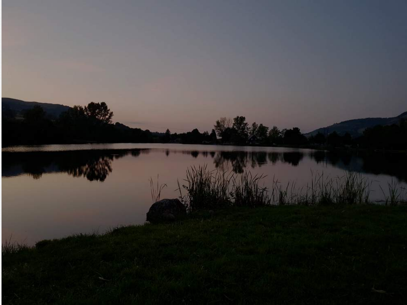
10. une scène de nuit bucolique – Lac des Cascades, Cantal, juillet 2020