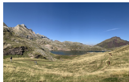
prise lors du we URASCE en vallée d'Aspe

Bonjour à tous, voici la newsletter du mois de septembre Bonne lecture.