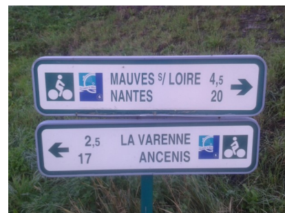
CC BY-SA Skimel