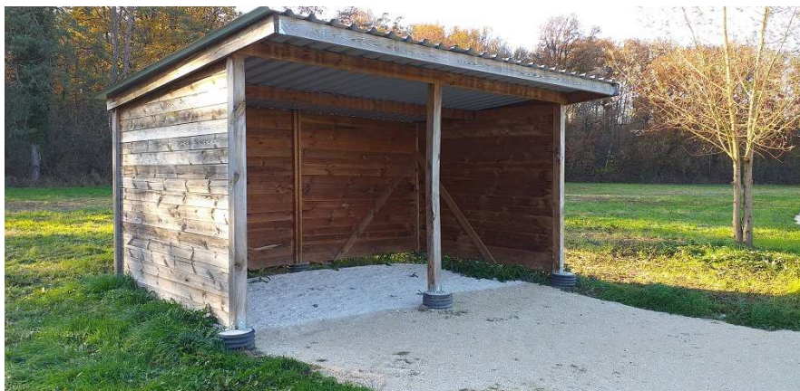
(le site dispose de 2 abris qui pourront être utilisés par l'organisation)

Pour ce qui est de l'alimentation électrique nécessaire notamment à l'équipe organisatrice, elle sera assurée soit par un groupe électrogène portatif, soit à l'aide de batterie (ou les 2).