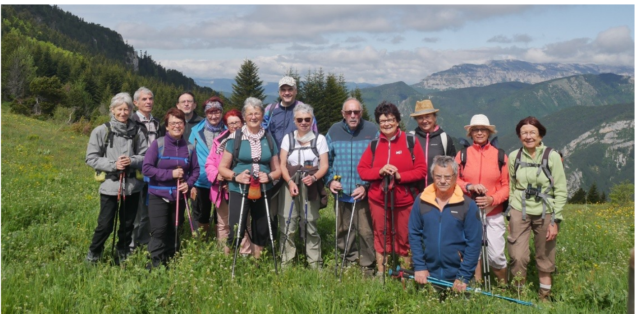
La photo de groupe au col des prêtres, prêt pour de nouvelles aventures en randonnées !

Après avoir laissé une petite arrière-garde sur place, et chaleureusement remercié nos hôtes qui le méritaient bien, le gros des troupes reprend les voitures en direction de l'Auvergne. Pour la plupart c'est l'occasion d'une petite pause gourmande à Tain-l'Hermitage et sa fameuse Cité du Chocolat, ou encore ses domaines viticoles, et pour tous le retour s'effectue peu ou prou dans le respect des délais imposés par le couvre-feu, qui entre alors en vigueur à partir de 21h00.