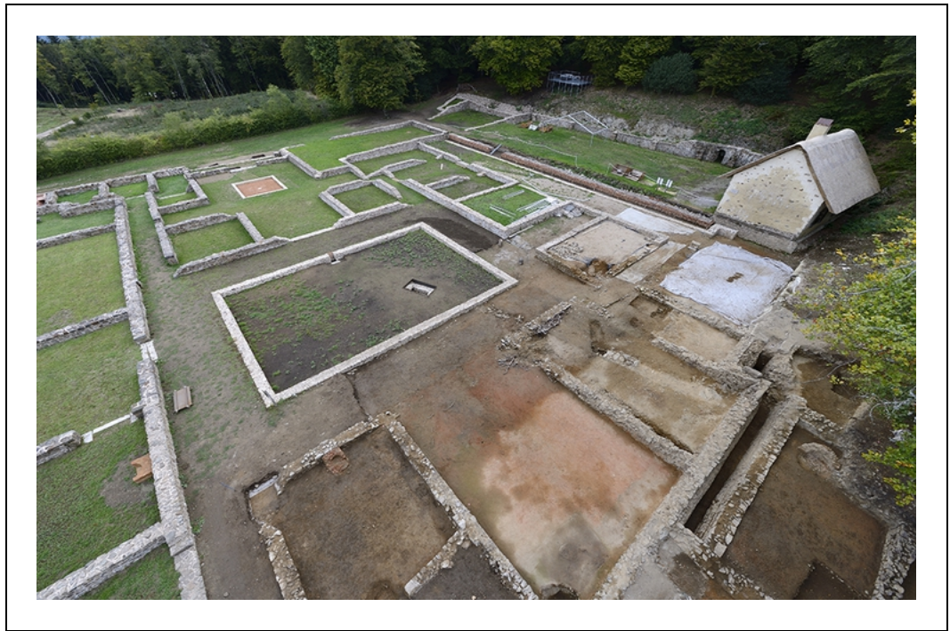
Site de Bibracte