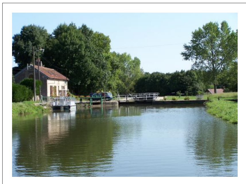
Petit port d'Escommes