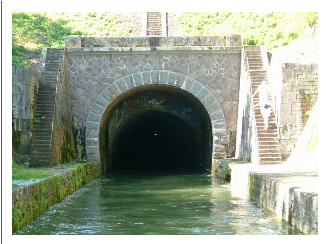
Tunnel (voûte) du canal de Bourgogne à Pouilly-en-Auxois