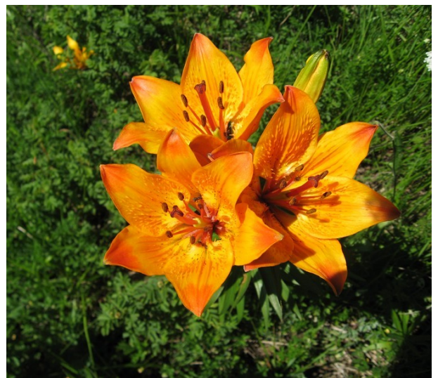
Le lys orangé