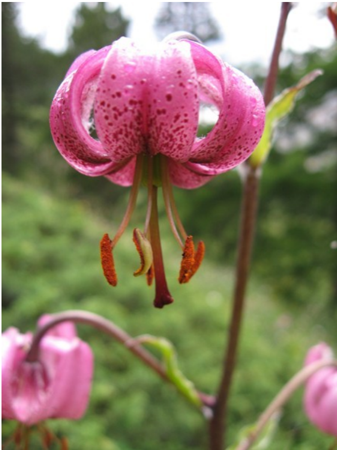
Le lys martagon