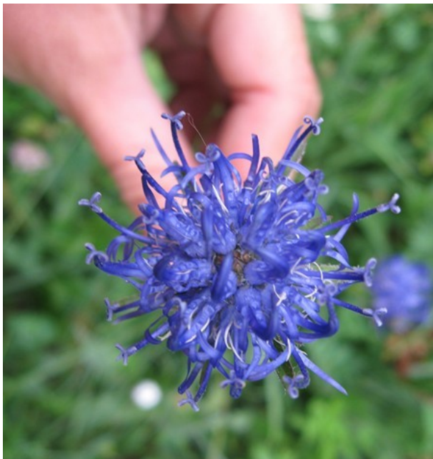
La raionce orbiculaire