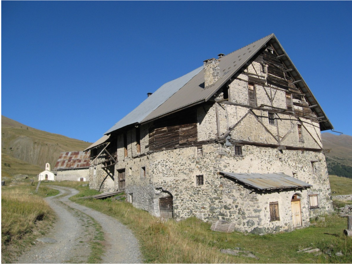
Une maison typique du Queyras