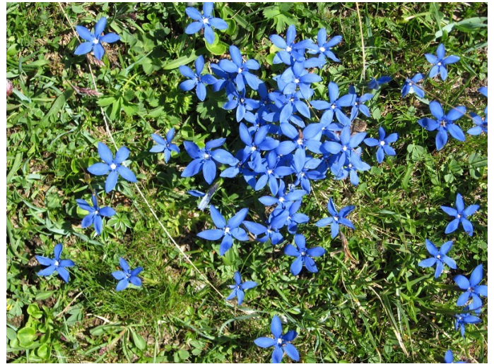
La gentiane printanière