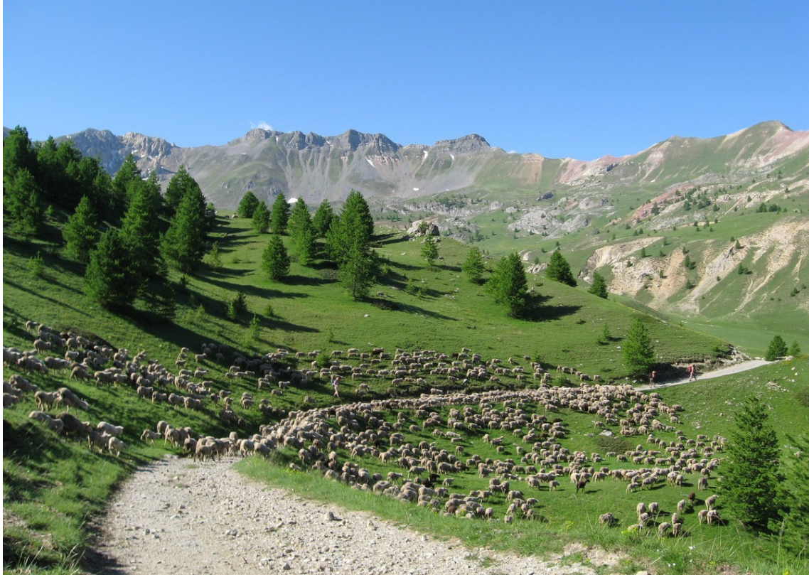
Le cirque du Morgon