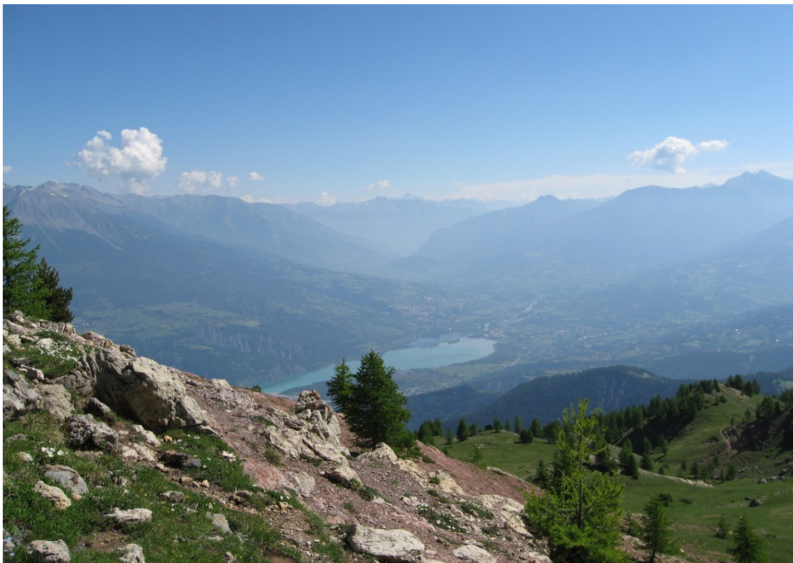
Le lac de Serre Ponçon depuis le pic du Morgon