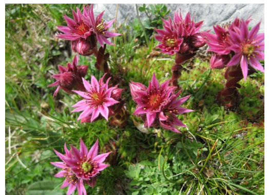
La joubarbe à toile d'araignée