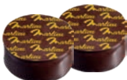
Ganache noir intense