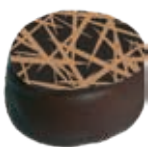
Ganache Noir intense en cacao