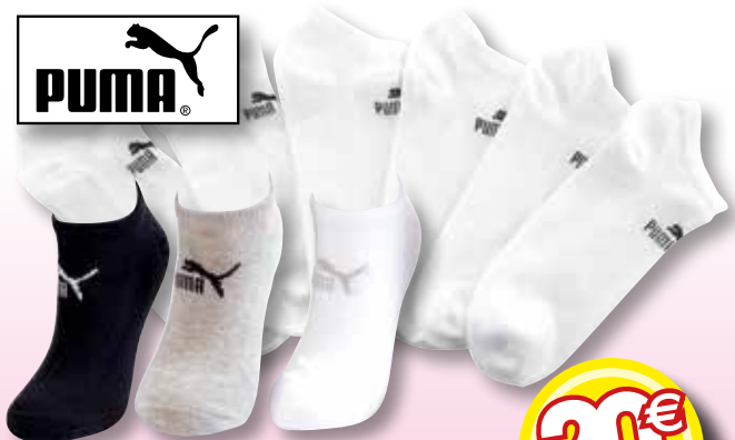
Ref. 460 (1 noire + 1 grise + 7 blanches) Chaussettes PUMA tige courte FEMME Composition : 72% coton - 26% polyester - 2% élasthanne 2 tailles : T1 (35/38) - T2 (39/42)

Les indispensables et les incontournables de votre quotidien