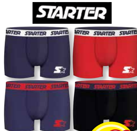
Ref. 804 Boxer Starter Composition : 58% coton 37% polyester - 5% élasthanne 4 tailles : T3 (medium) - T4 (large) T5 (extra-large) - T6 (XXL)