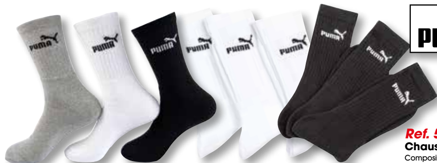
Ref. 514 (4 noires + 1 grise + 4 blanches) Chaussettes PUMA Tennis HOMME Composition : 75% coton - 21% polyester 4% élasthanne - 2 tailles : T1 (39/42) - T2 (43/46)