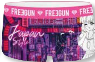
Ref. 939 Shorty Freegun

Composition : 92% polyester - 8% élasthanne 5 tailles : T1 (6/8 ans) - T2 (8/10 ans) - T3 (10/12 ans) - T4 (12/14 ans) - T5 (14/16 ans)