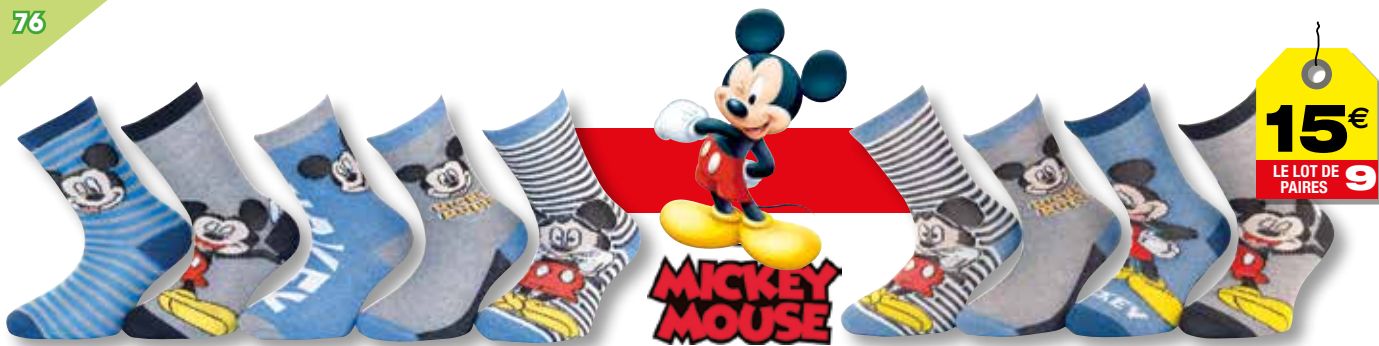
Ref. 623 Chaussettes Mickey Composition : 50% polyester - 48% coton - 2% élasthanne - 3 tailles : T1 (23/26) - T2 (27/30) - T3 (31/34)