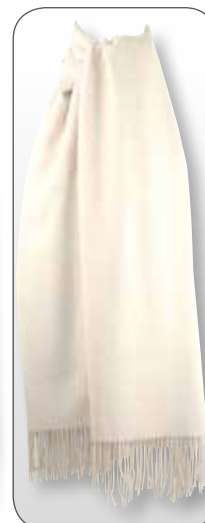
Ref. 193 écru