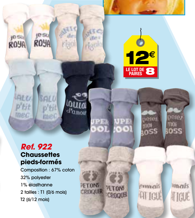
Ref. 922 Chaussettes pieds-formés

Composition : 67% coton 32% polyester 1% élasthanne 2 tailles : T1 (0/6 mois) T2 (6/12 mois)