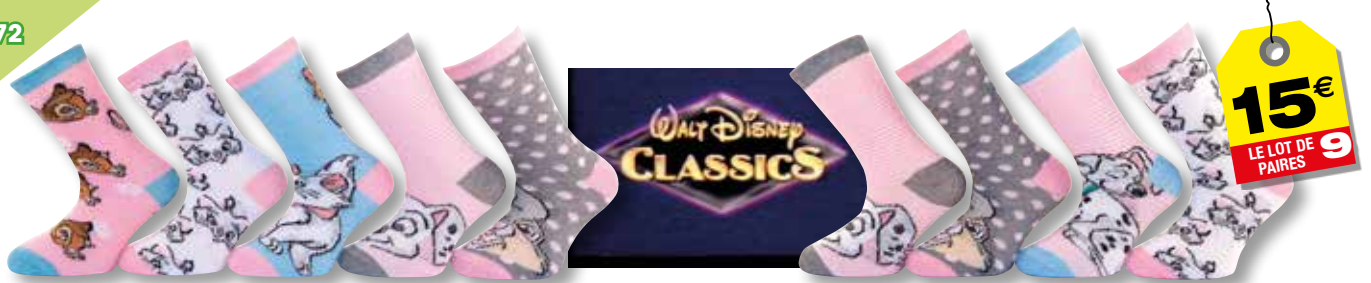
Ref. 627 Chaussettes Disney Classic Composition : 50% polyester - 48% coton - 2% élasthanne - 3 tailles : T1 (23/26) - T2 (27/30) - T3 (31/34)