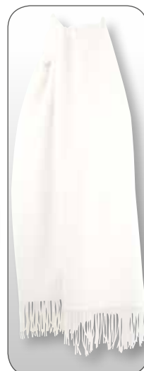
Ref. 194 blanc

Agence Face à face : Offre valable jusqu'au 15/07/2024 dans la mesure des stocks disponibles. Sauf erreur typographique. Photos non contractuelles. Ne pas jeter sur la voie publique. Photographies de mannequins de ce catalogue : photographies retouchées.