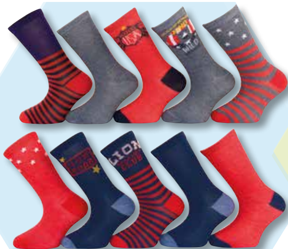
Ref. 912 Chaussettes Wild Composition : 98% polyester - 2% élasthanne 3 tailles : T1 (23/26) - T2 (27/30) - T3 (31/34)