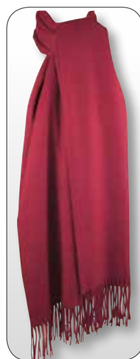
Ref. 188 rouge carmin