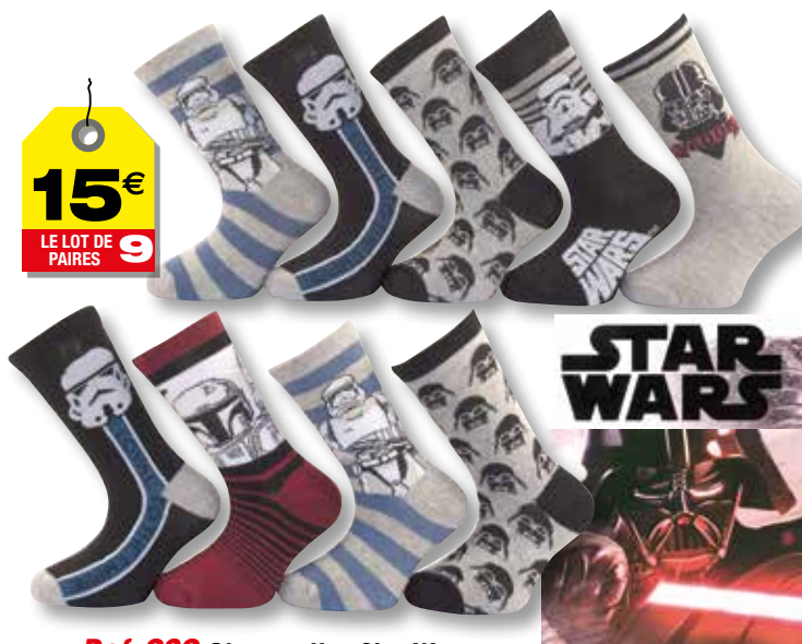
Ref. 929 Chaussettes Star Wars

Composition : 63% coton - 35% polyester - 2% élasthanne 3 tailles : T1 (27/30) - T2 (31/34) - T3 (35/38)