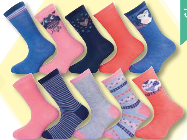
Ref. 913 Chaussettes Cool Composition : 98% polyester 2% élasthanne - 3 tailles : T1 (23/26) - T2 (27/30) - T3 (31/34)