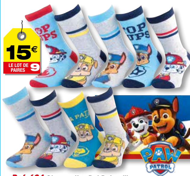
Ref. 624 Chaussettes Pat Patrouille

Composition : 63% coton - 35% polyester - 2% élasthanne 3 tailles : T1 (27/30) - T2 (31/34) - T3 (35/38)