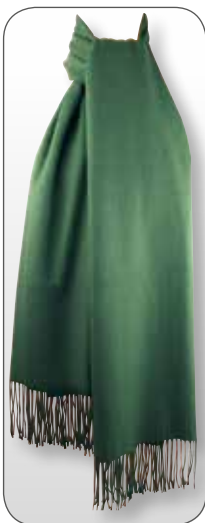
Ref. 184 vert foncé