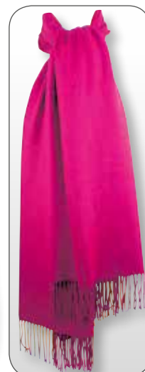
Ref. 191 fuschia