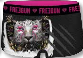
Ref. 942 Shorty Freegun

Composition : 92% polyester - 8% élasthanne 5 tailles : T1 (6/8 ans) - T2 (8/10 ans) - T3 (10/12 ans) - T4 (12/14 ans) - T5 (14/16 ans)