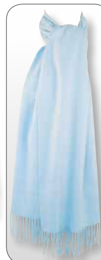
Ref. 192 bleu ciel