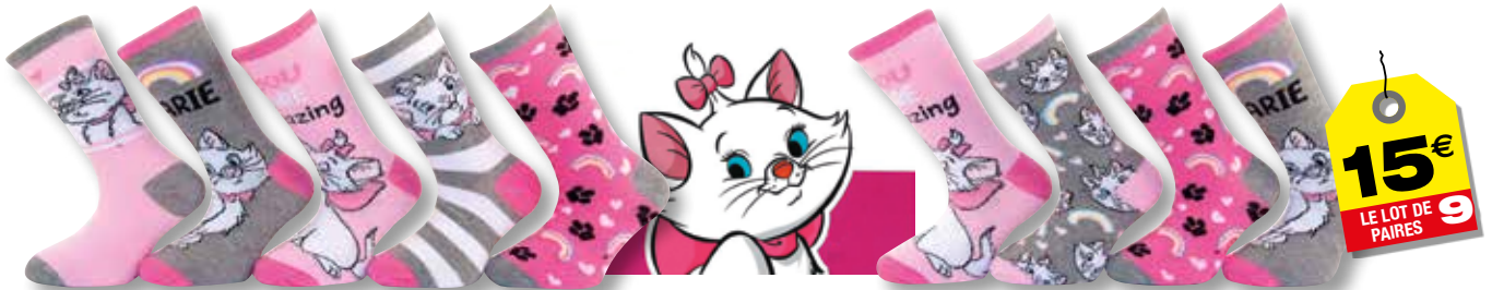
Ref. 930 Chaussettes Aristochat Composition : 49% coton - 48% polyester - 3% élasthanne - 3 tailles : T1 (24/26) - T2 (27/30) - T3 (31/34)