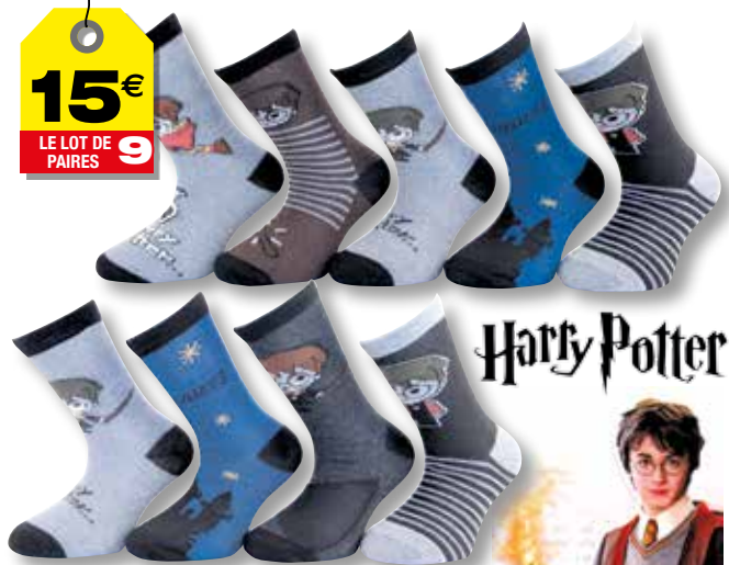
Ref. 639 Chaussettes Harry Potter Composition : 76% polyester - 22% coton - 2% élasthanne 2 tailles : T1 (23/26) - T2 (27/30)