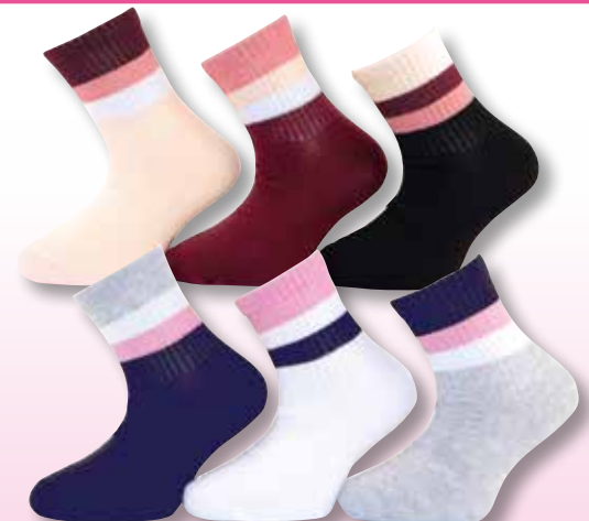
Ref. 936 Chaussettes tige 3/4 Sergio Tacchini

Composition : 66% coton - 32% polyester - 2% élasthanne 3 tailles : T1 (27/30) - T2 (31/35) - T3 (36/39)