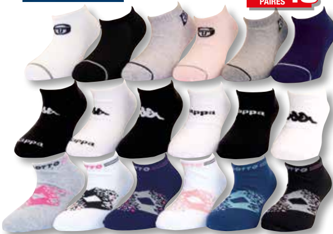
Ref. 918 Chaussettes tige courte Kappa, Lotto, Sergio Tacchini

Composition : 71% coton - 27% polyester - 2% élasthanne 3 tailles : T1 (27/30) - T2 (31/35) - T3 (36/39)