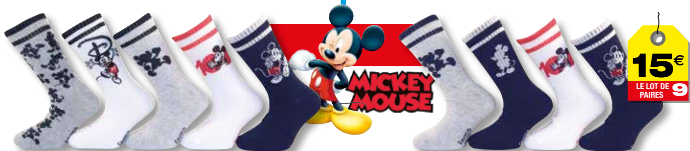
Ref. 935 Chaussettes Mickey Composition : 52% coton - 37% polyester - 5% polyamide - 4% élastodienne - 2% élasthanne - 3 tailles : T1 (23/26) - T2 (27/30) - T3 (31/34)