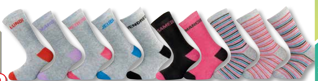
Ref. 911 Chaussettes Semainier Composition : 73% polyester - 25% coton - 2% élasthanne 3 tailles : T1 (23/26) - T2 (27/30) - T3 (31/34)