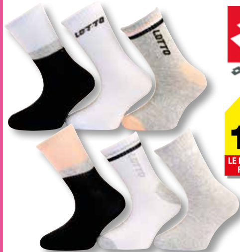
Ref. 938 Chaussettes Lotto

Composition : 59% coton - 36% polyester - 1% élasthanne 4% élastodienne - 3 tailles : T1 (27/30) - T2 (31/35) - T3 (36/39)