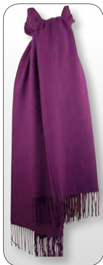
Ref. 183 violet