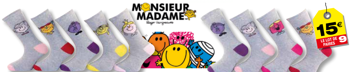
Ref. 933 Monsieur madame Composition : 61% coton - 26% polyester - 11% polyamide - 2% élasthanne - 3 tailles : T1 (23/26) - T2 (27/30) - T3 (31/35)