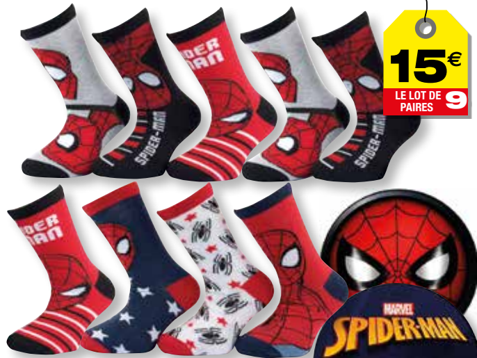
Ref. 625 Chaussettes Spiderman Composition : 50% polyester - 48% coton - 2% élasthanne 3 tailles : T1 (23/26) - T2 (27/30) - T3 (31/34)