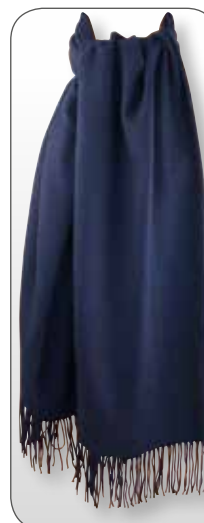
Ref. 189 bleu marine