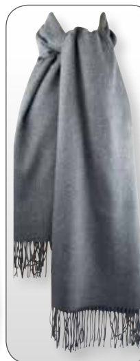
Ref. 182 gris moyen