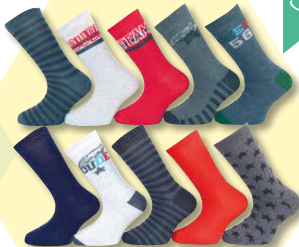
Ref. 915 Chaussettes Collège Composition : 55% polyester - 41% coton - 2% polyamide 1% élasthanne - 1% viscose - 3 tailles : T1 (27/30) - T2 (31/34) - T3 (35/38)