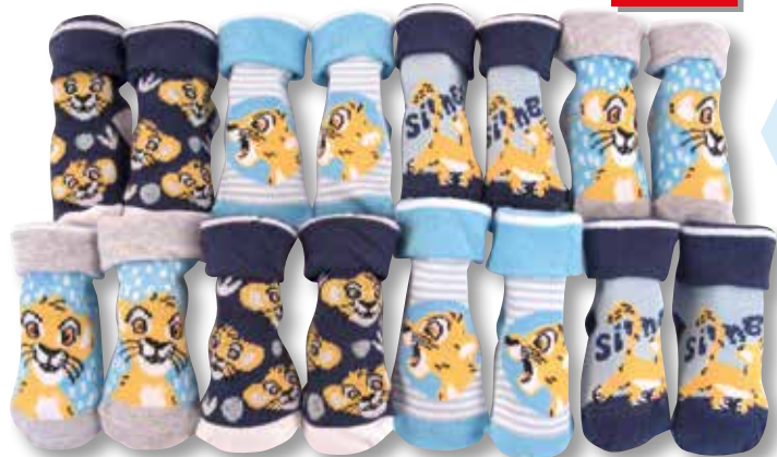
Ref. 923 Chaussettes pieds-formés Le Roi Lion

Composition : 60% coton - 39% polyester - 1% élasthanne 2 tailles : T1 (0/6 mois) - T2 (6/12 mois)