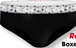
Ref. 940 Boxer Freegun

Composition : 95% coton - 5% élasthanne 5 tailles : T1 (6/8 ans) - T2 (8/10 ans) - T3 (10/12 ans) - T4 (12/14 ans) - T5 (14/16 ans)