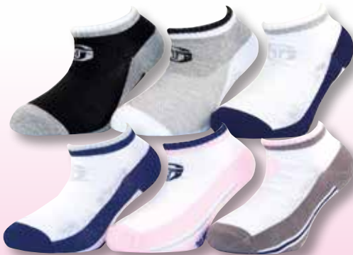
Ref. 937 Chaussettes tige courte Sergio Tacchini

Composition : 66% coton - 32% polyester - 2% élasthanne 3 tailles : T1 (27/30) - T2 (31/35) - T3 (36/39)