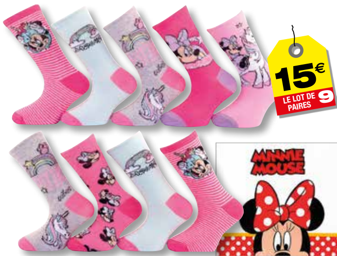
Ref. 931 Chaussettes Minnie

Composition : 52% coton - 26% polyester - 20% polyamide 2% élasthanne - 3 tailles : T1 (24/26) - T2 (27/30) - T3 (31/35)