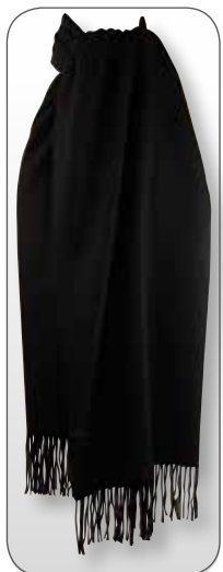
Ref. 185 noir