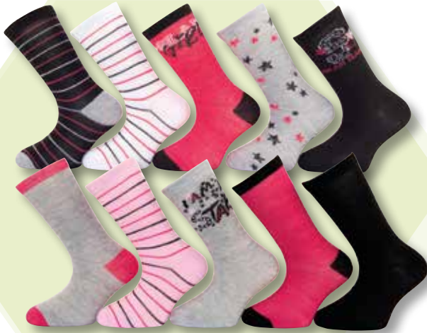
Ref. 914 Chaussettes Star Composition : 98% polyester 2% élasthanne - 3 tailles : T1 (23/26) - T2 (27/30) - T3 (31/34)