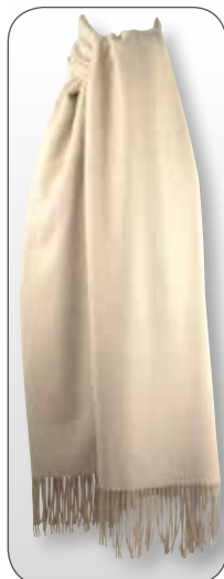
Ref. 186 beige