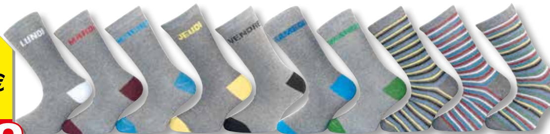
Ref. 910 Chaussettes Semainier Composition : 73% polyester - 25% coton - 2% élasthanne 3 tailles : T1 (23/26) - T2 (27/30) - T3 (31/34)