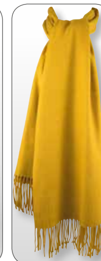
Ref. 190 moutarde