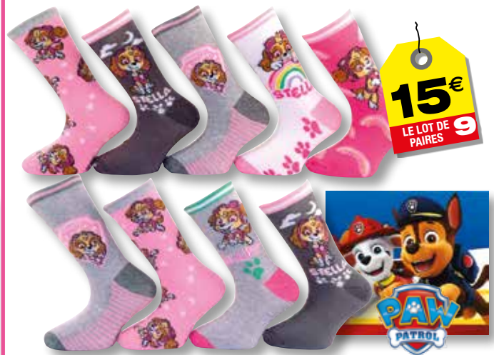
Ref. 932 Chaussettes Pat Patrouille

Composition : 52% coton - 26% polyester - 20% polyamide 2% élasthanne - 3 tailles : T1 (24/26) - T2 (27/30) - T3 (31/35)