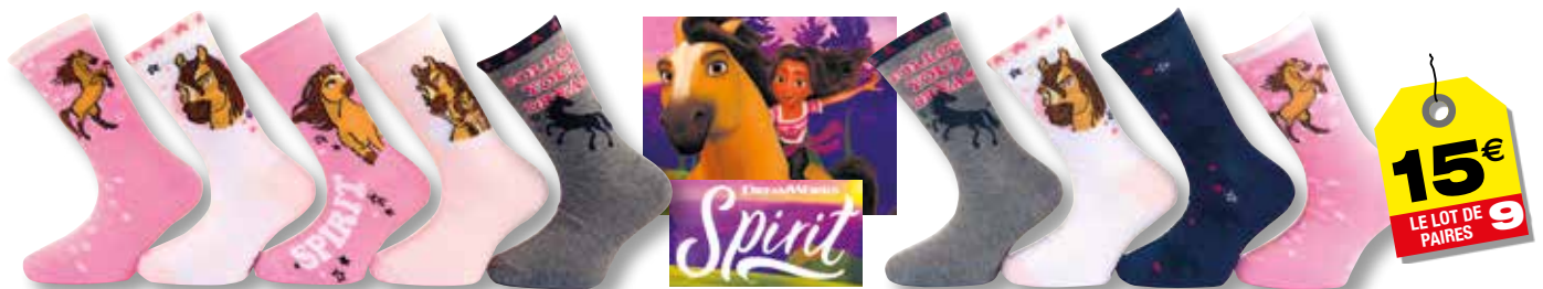
Ref. 934 Chaussettes Spirit Composition : 63% coton - 25% polyester - 11% polyamide - 1% élasthanne - 3 tailles : T1 (27/30) - T2 (31/34) - T3 (35/38)

Composition : 54% coton - 25% polyester - 19% polyamide 2% élasthanne - 3 tailles : T1 (23/26) - T2 (27/30) - T3 (31/35)