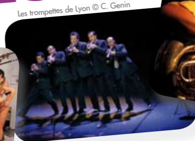
Les trompettes de Lyon