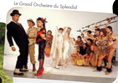
Le Grand Orchestre du Splendid