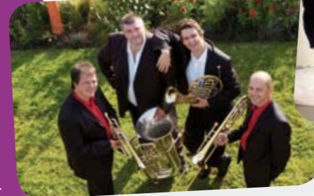
Ensemble Epsilon