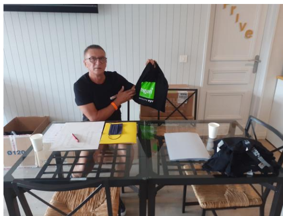
distribution d'un panier souvenir