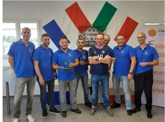
ASCE 76 CEREMA