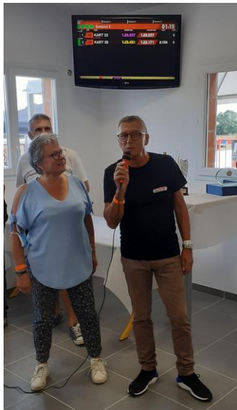
Le président ASCE 17