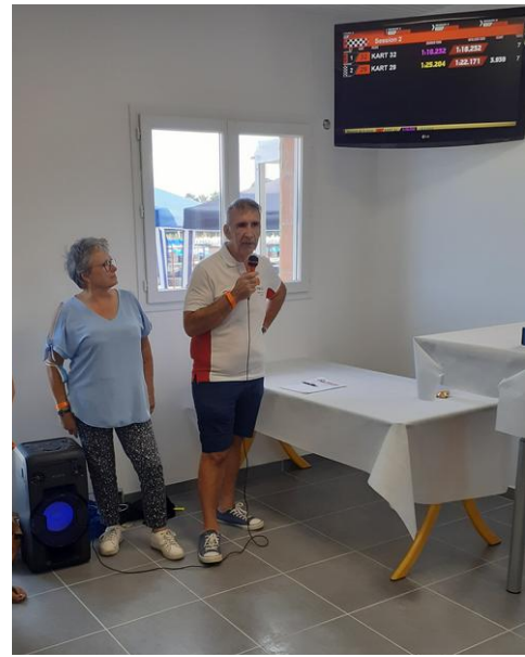
le représentant de la CPS FNASCE