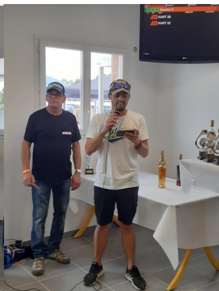
le directeur de course