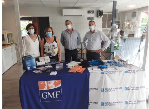
stands de nos partenaires BFM et GMF

Pour le repas de cette première soirée, nous avons dîné au « GRILL Inn » situé à 2 pas de notre hôtel, où les gérants nous ont accueilli dans un espace privatisé pour l'occasion et vu le nombre de personnes.