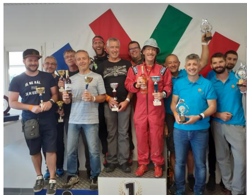
ASCE 18 - ASCE 73/2 - ASCE 82