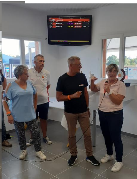
la responsable du Karting