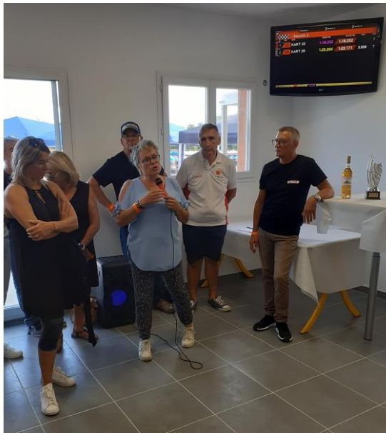
La présidente de la FNASCE