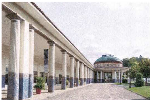
Les thermes de Contrexéville