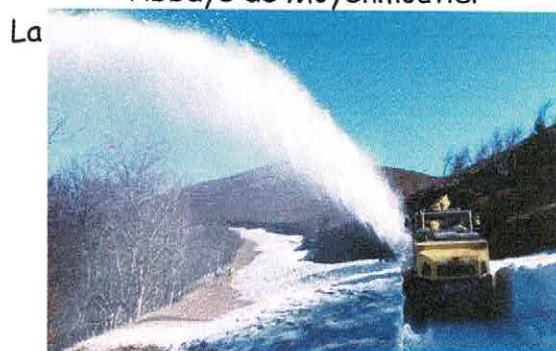
route des crêtes