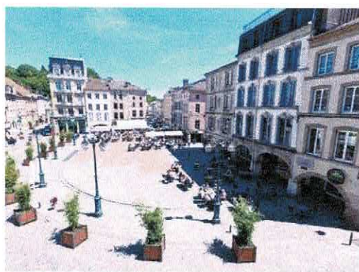
Epinal - place des Vosges

Département de culture et de nature, les Vosges recèlent un patrimoine connu, parmi lequel on peut citer quelques éléments emblématiques : l'imagerie d'Epinal, la maison natale de Jeanne d'Arc à Domrémy-la-Pucelle, le théâtre du peuple de Bussang... C'est aussi le département de naissance et de scolarité de Nicolas MATHIEU, prix Goncourt 2018.