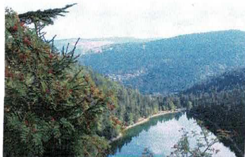
Lac des Corbeaux