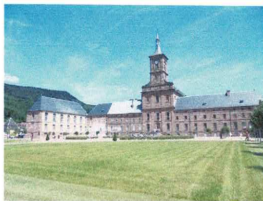
Abbaye de Moyenmoutier