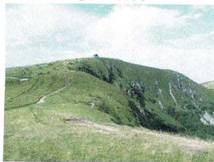
Sommet du Hohneck