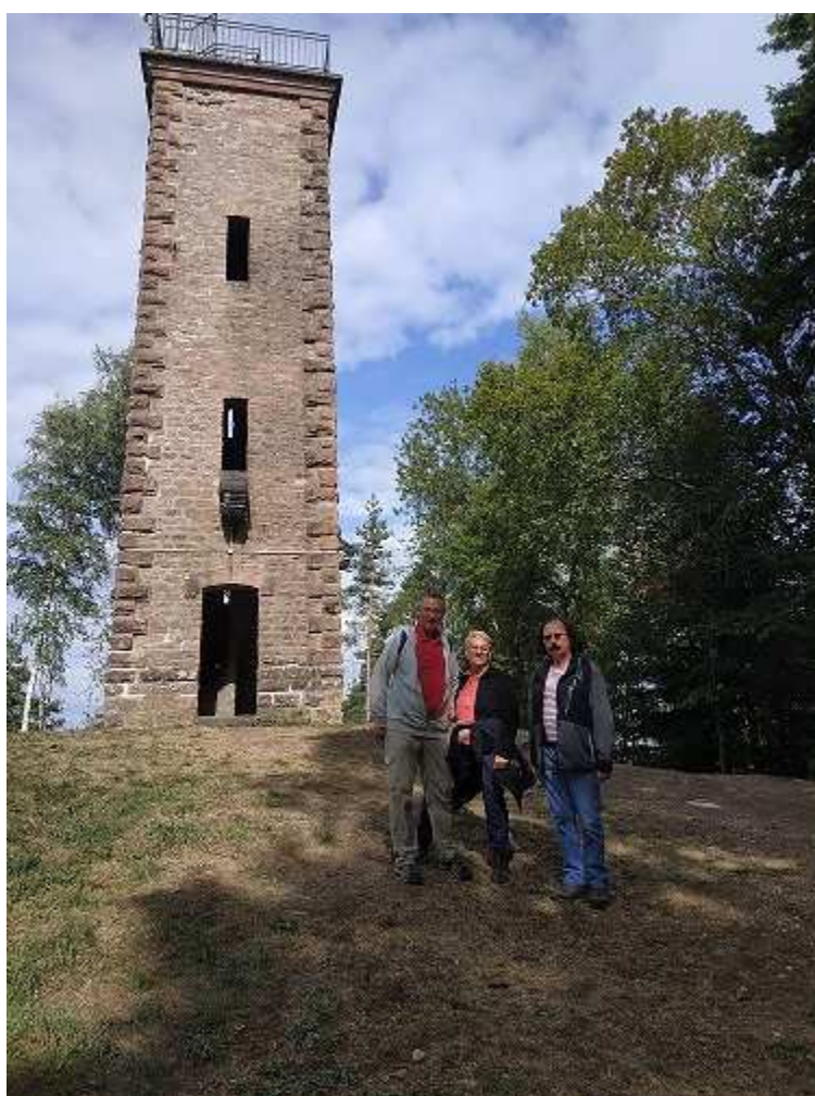
Les marcheurs meusiens