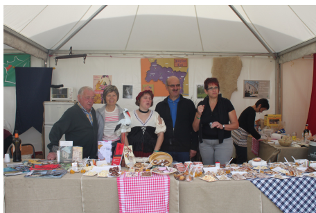
Stand région 2012

Vous trouverez les différents bulletins d'inscription à la fin de ce BO.