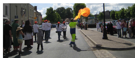
La cavalcade 2012