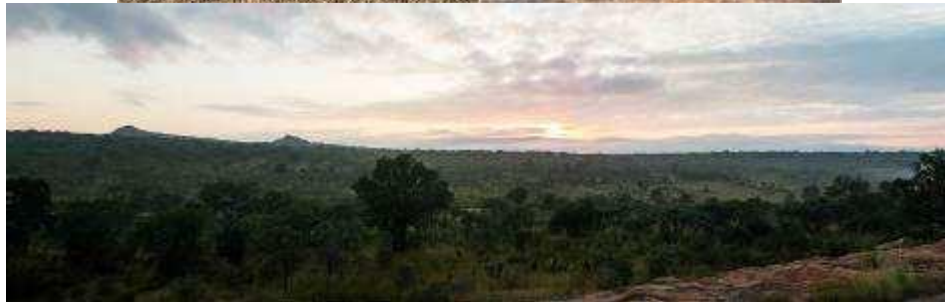
SWAZILAND — MOUNTAIN INN