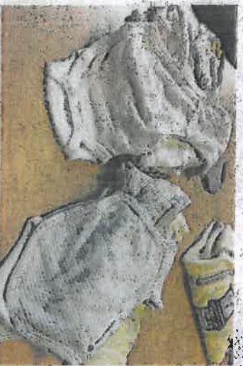
Des bodies transformés par les couturières des Bodies de Léon.

Depuis la création de l'association, en juillet 2013, Agnès a récupéré 500 bodies et autres pyjamas, elle a écumé les bourses de puériculture et pu compter sur la générosité des exposants. Mais aussi sur les antennes locales du Secours Populaire et de La Croix-Rouge. Elle a multiplié les courriers aux fabricants de bodies et reçu quelques réponses favorables. La marque Petit Bateau lui a ainsi adressé un envoi de 100 bodies, taille prématurée.