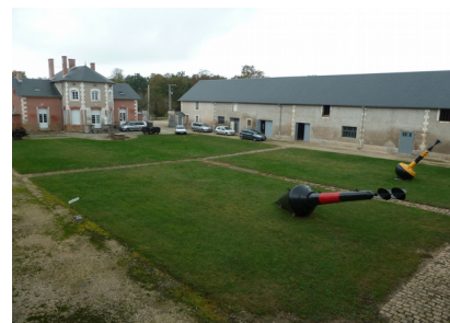
La maison de maître et l'aile gauche

Renseignement auprès de votre responsable ASCE ou de Germaine VERPOEST germaine.verpoest@vosges.gouv.fr ASCE 88 – 22 à 26 Avenue Dutac - 88 000 EPINAL - TEL :03.29.69.13.52