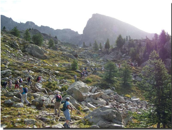
La montée vers les lacs de Terre Rouge