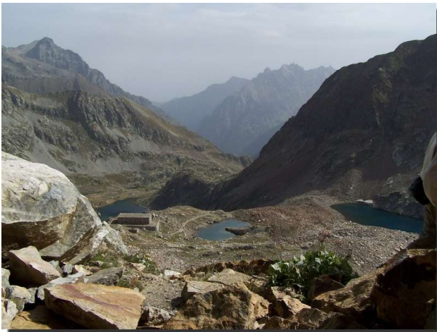
Vue depuis la baisse de Druos sur le versant italien

Le premier groupe part directement en direction des lacs pour arriver vers 11h00 à la baisse de Druos, qui marque la frontière entre la France et l'Italie, la dénivellée à absorber est voisine de 630 m. Le deuxième groupe s'arrête aux lacs où tout le monde se retrouvera à l'heure du déjeuner. De la Baisse une belle vue s'offre sur la chaîne du Mercantour et côté italien sur les lacs de Valscura. De nombreuses fortifications sont encore bien visibles, un passage creusé dans la roche servait aux soldats italiens de poste de surveillance sur le côté français.