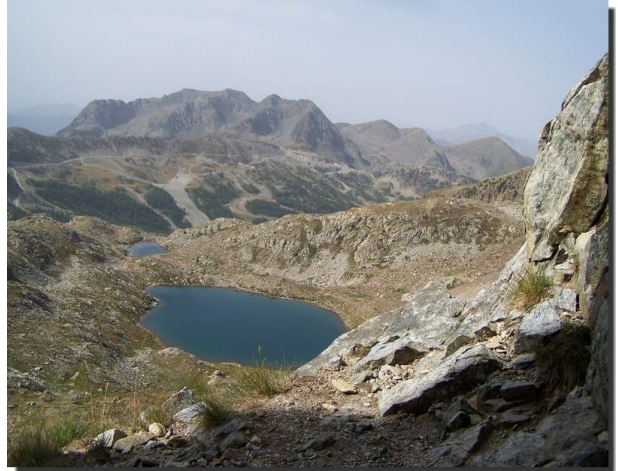
Ces lacs de Terre Rouge