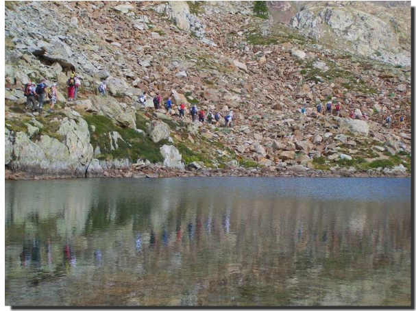
Reflets sur le lac

Le premier groupe part directement en direction des lacs pour arriver vers 11h00 à la baisse de Druos, qui marque la frontière entre la France et l'Italie, la dénivellée à absorber est voisine de 630 m. Le deuxième groupe s'arrête aux lacs où tout le monde se retrouvera à l'heure du déjeuner. De la Baisse une belle vue s'offre sur la chaîne du Mercantour et côté italien sur les lacs de Valscura. De nombreuses fortifications sont encore bien visibles, un passage creusé dans la roche servait aux soldats italiens de poste de surveillance sur le côté français.