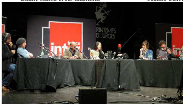
Émission de France Inter en direct