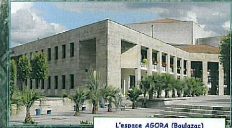
L'espace AGORA (Boulazac)