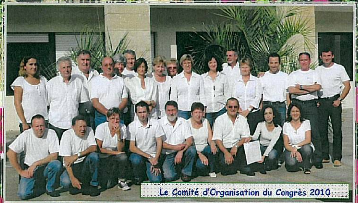
Le Comité d'Organisation du Congrès 2010.

Association Sportive, Culturelle et d'Entraide de l'Équipement de la Dordogne ~ Cité administrative Bugaud 10 rue du 26ème R.I 24016 Périgueux cedex