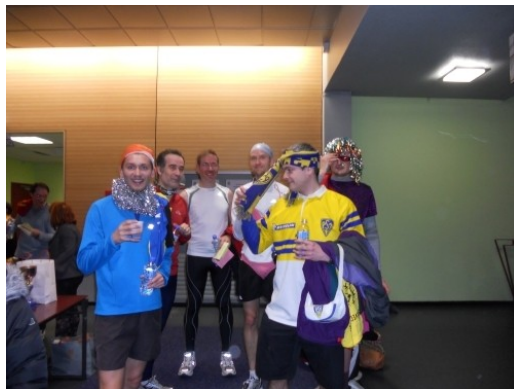
Corrida de la Saint Sylvestre