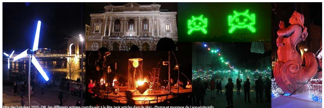
Fête des lumières 2010 - DR : les différents artistes contribuant à la fête (voir articles dans le site) - Photos et montage de Lyon-visite.info

Que serait Lyon sans ses bouchons, je parle là de ces lieux où la cuisine traditionnelle de Lyon vient titiller les papilles du gastronome et non pas de ces engorgements routiers qui viennent titiller le pied de l'automobiliste frustré. Nous ne sommes donc pas passés à côté de ce patrimoine : le « Val d'Isère » le jeudi et « l'alternative » le vendredi nous ont accueillis pour déguster les spécialités locales.