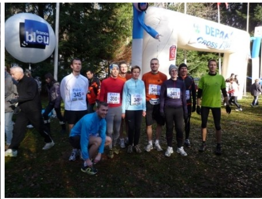
Cross de Volvic