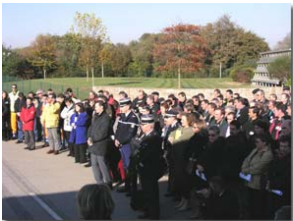
La minute de silence