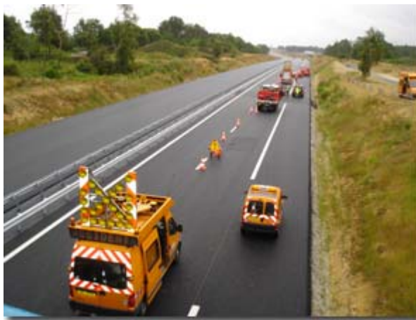
L'exercice d'intervention d'urgence avec les Forces de l'Ordre, les Pompiers et l'Équipement.