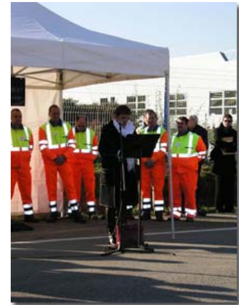
Thérèse THIÉRY Maire de LANESTER