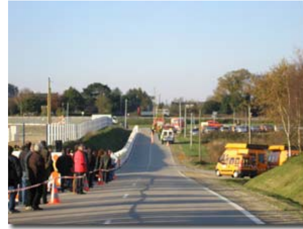
L'exercice a eu lieu dans la rue Jean Noël JÉGO