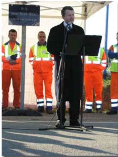
Rémy HEITZ Délégué Interministériel à la Sécurité Routière