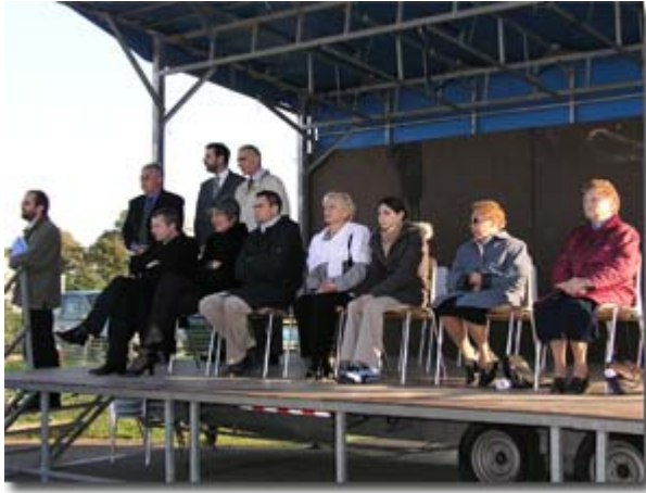
La famille et les personnalités durant l'exercice.