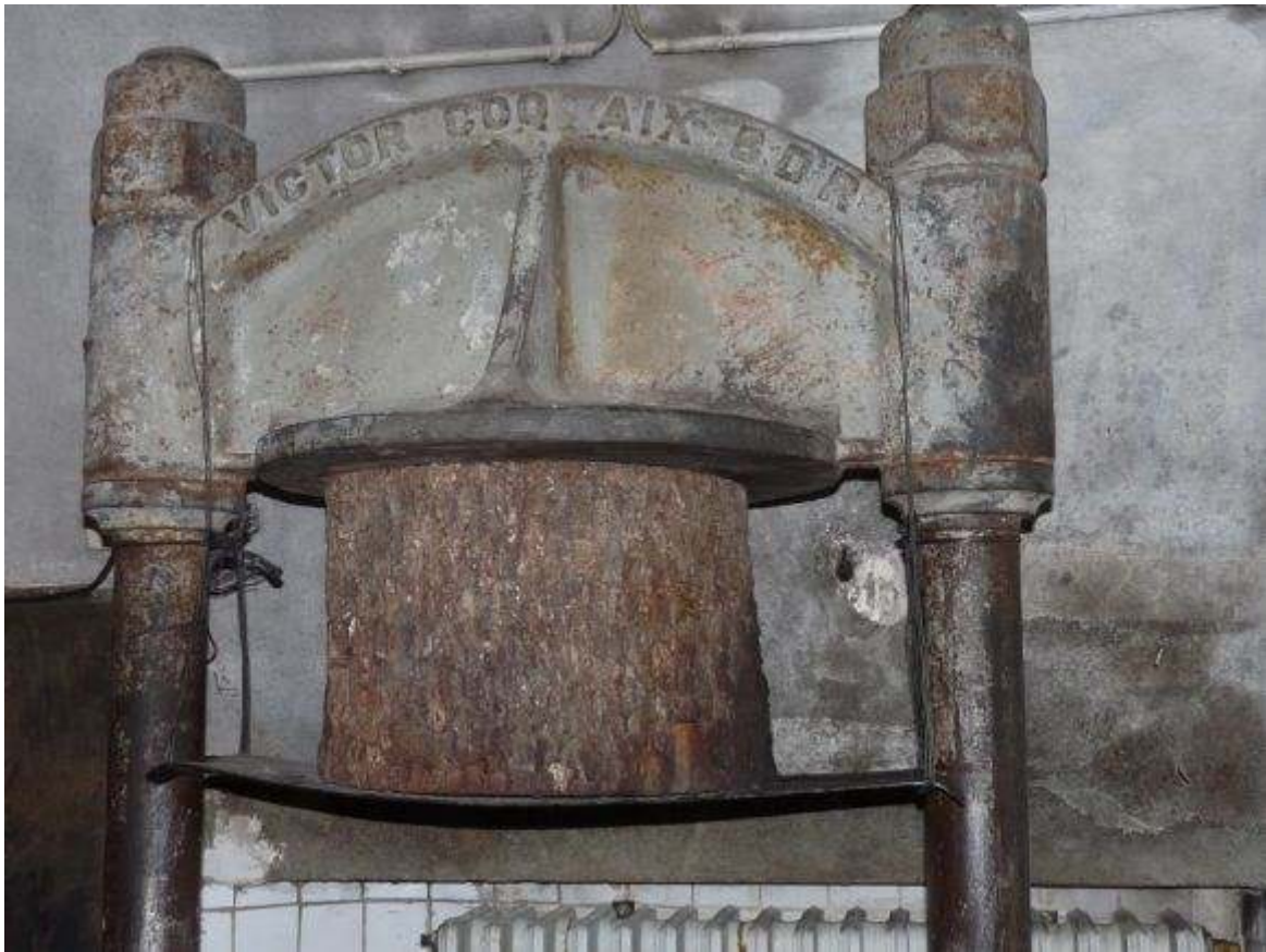
Le moulin à huile