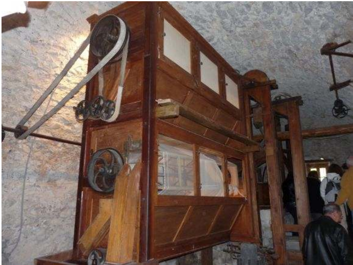
Le moulin à farine