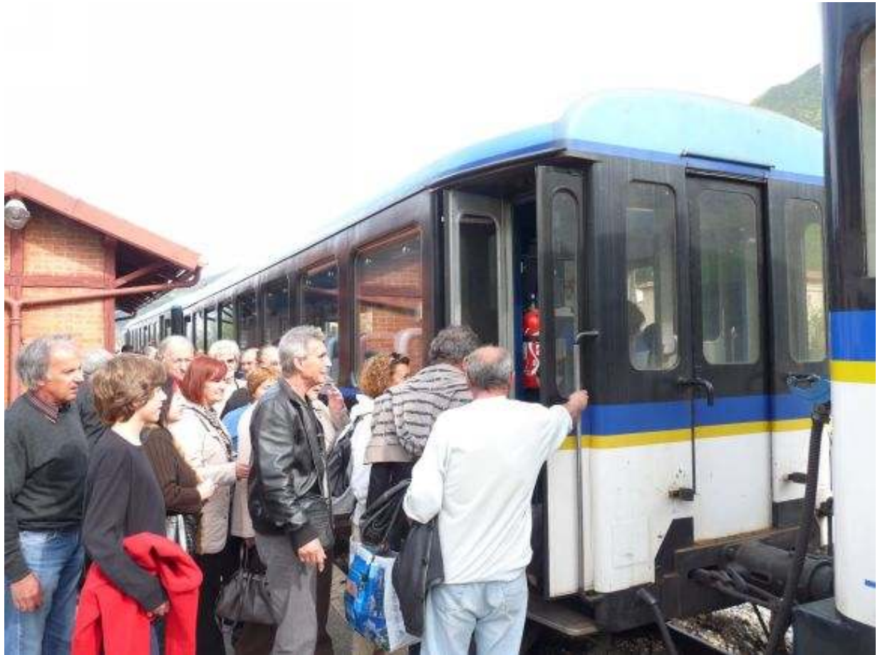
Et en route pour le retour