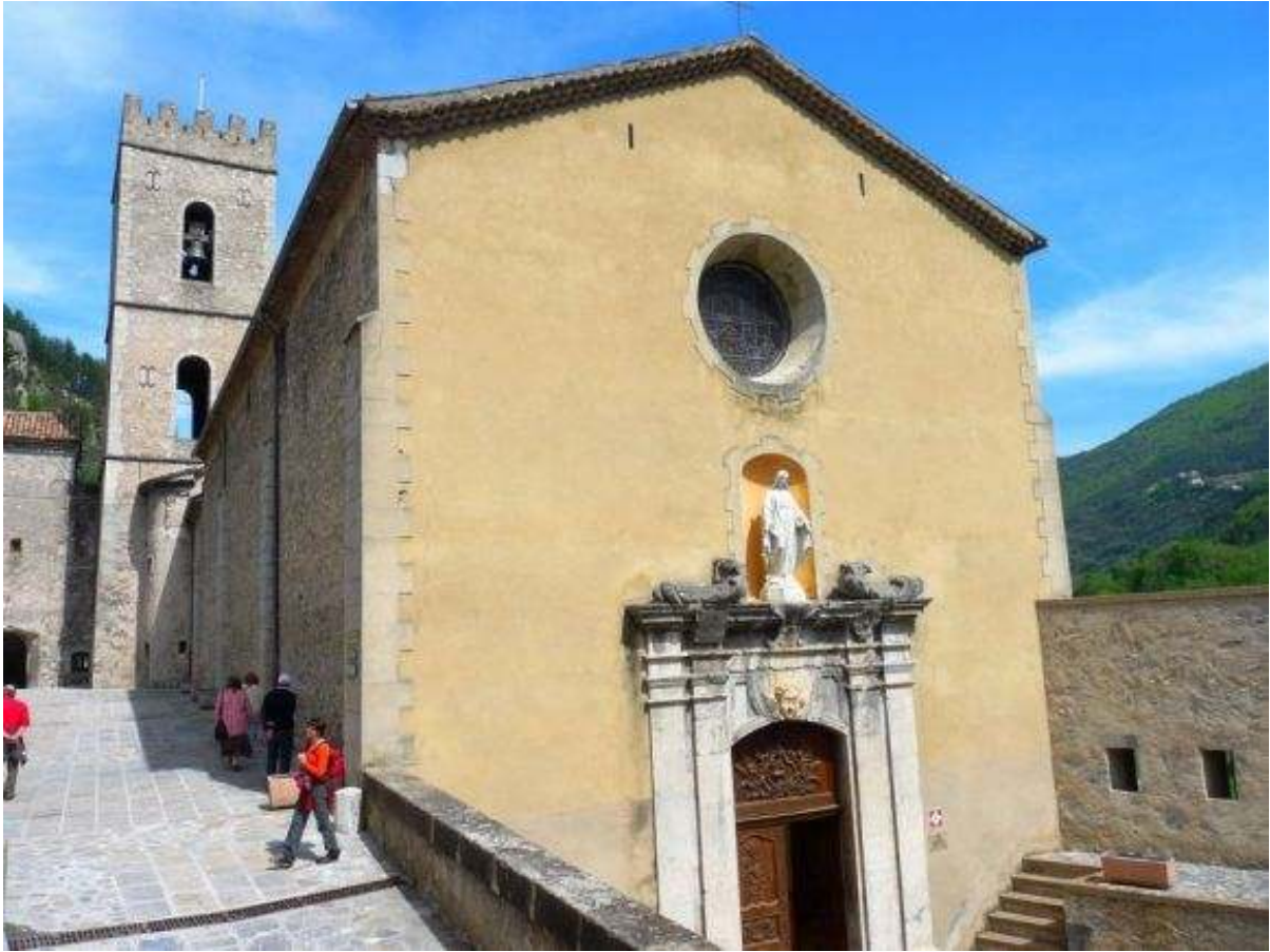
La cathédrale Notre Dame de l'Assomption