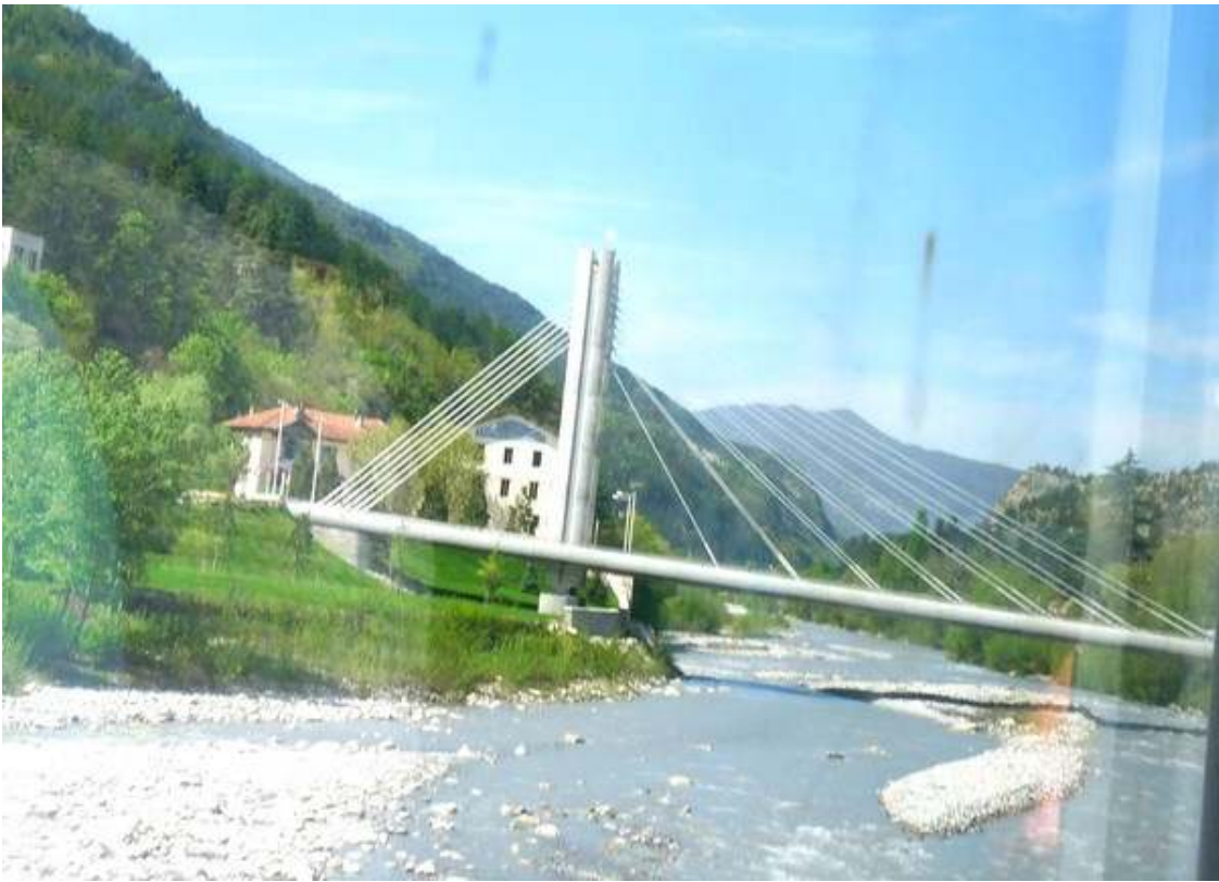
Le pont de Puget Théniers