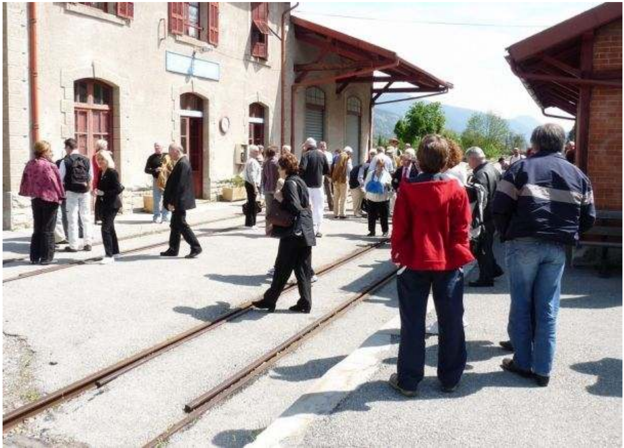
L'arrivée à Entrevaux