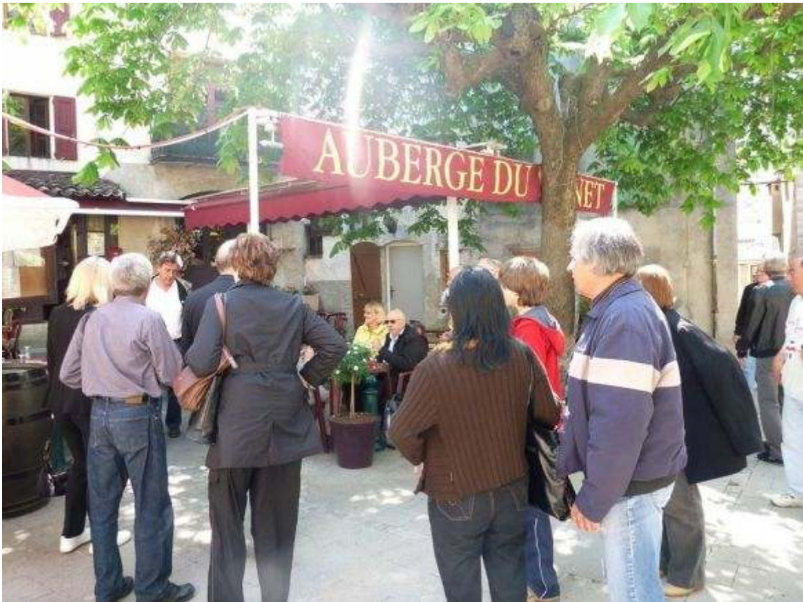
Le soleil était de la partie et la terrasse de l'auberge du Planet très tentante