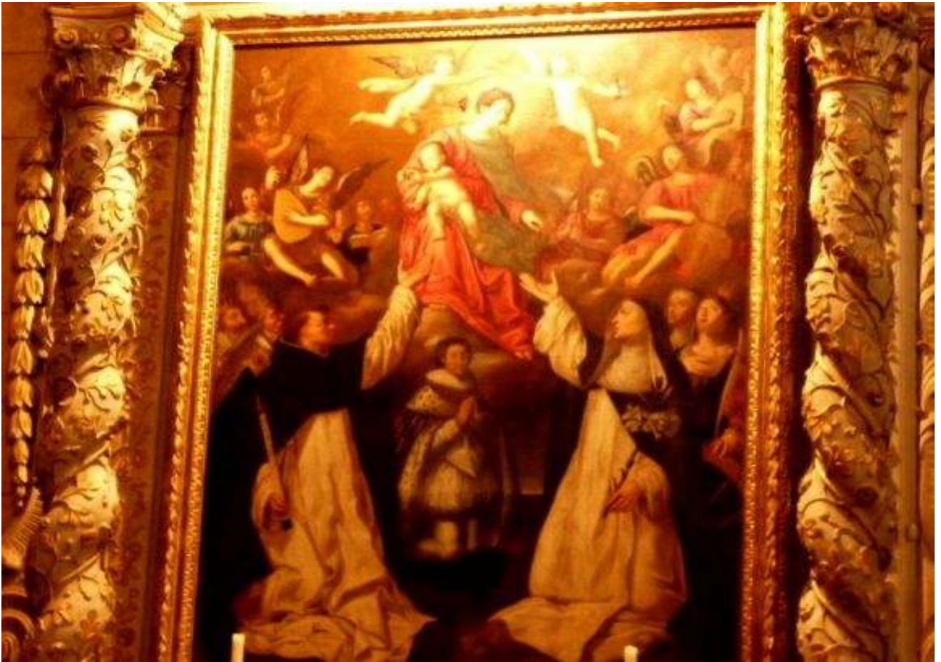
Toile « Notre Dame de Rosaire » 1631