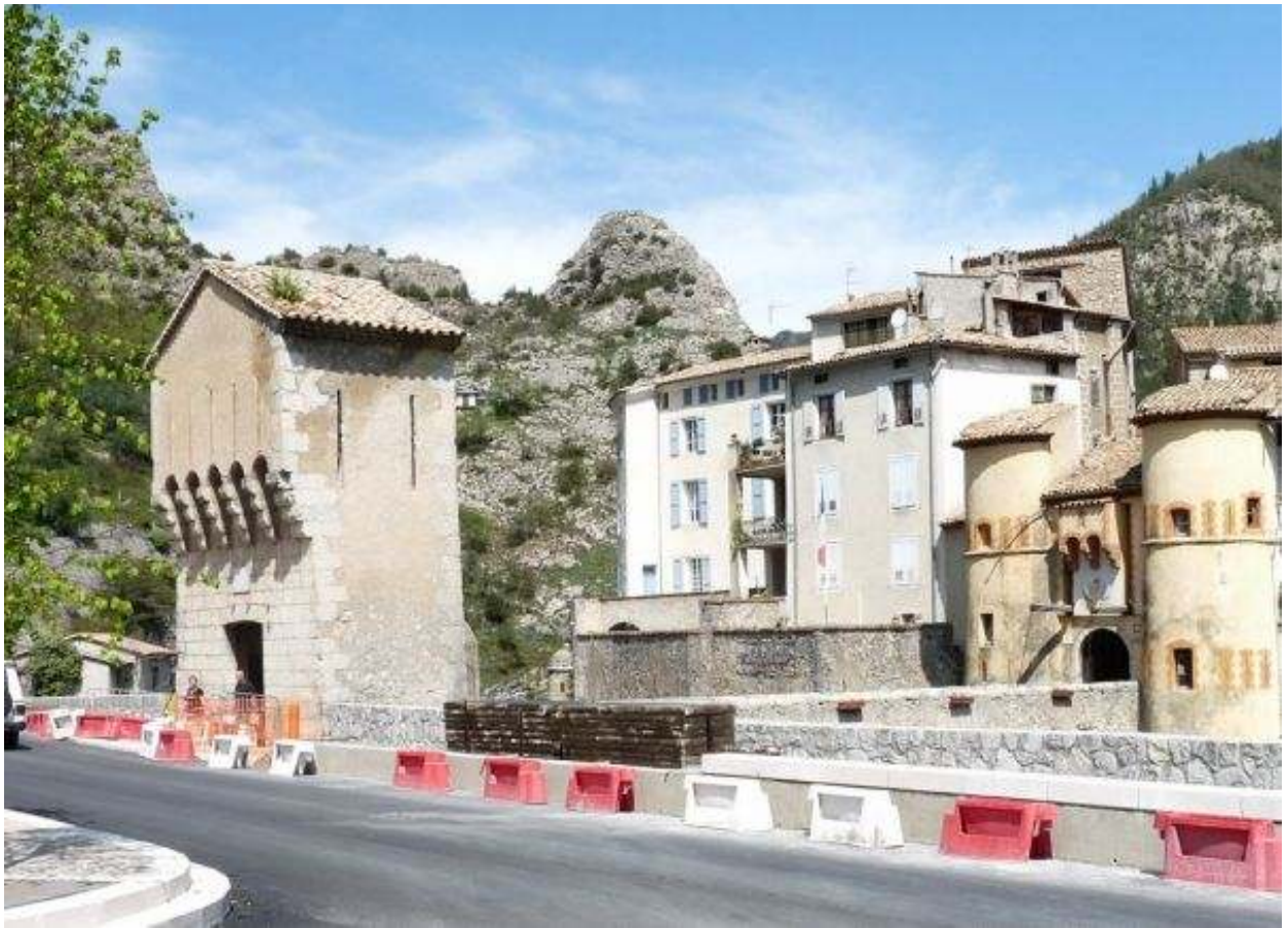
La porte Royale