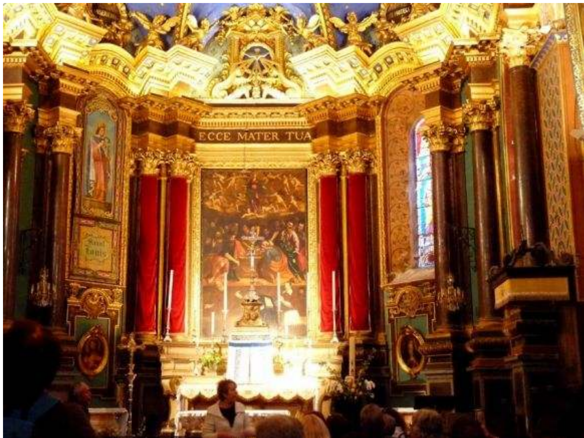
Le chœur orné de la toile « « Notre Dame de l'Assomption » »1630 »