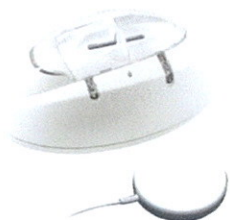
Solution Malentendants Ei170RF