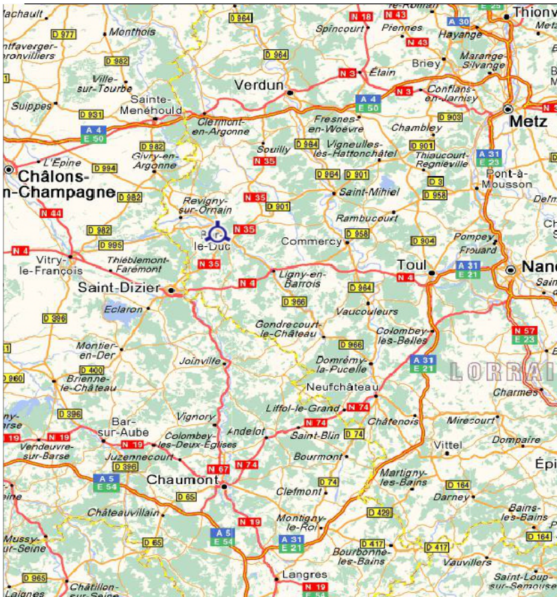
Extraits Via Michelin