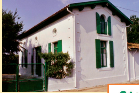
Port des Barques (17)