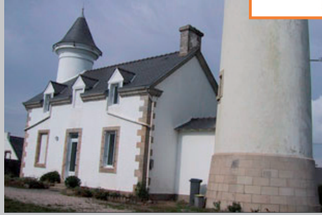
Port Navalo (56)