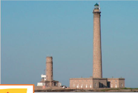
Phare de Gatteville (50)