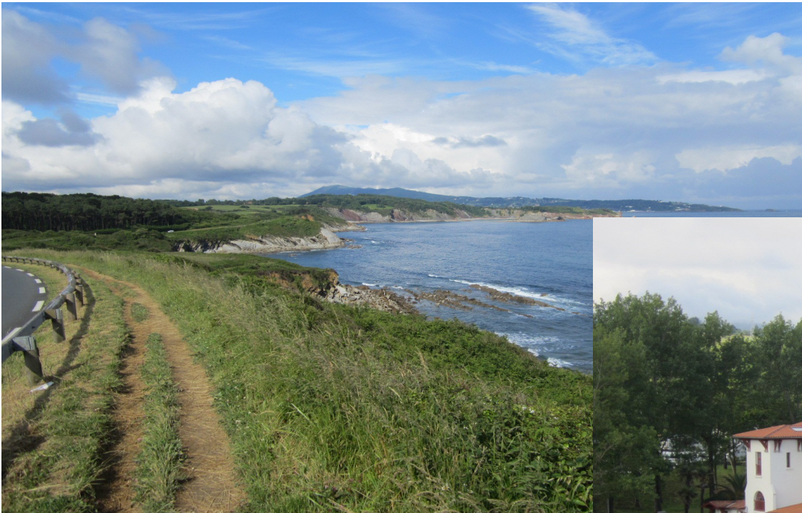
Domaine Haizabia (« Unité d'accueil » des cheminots)