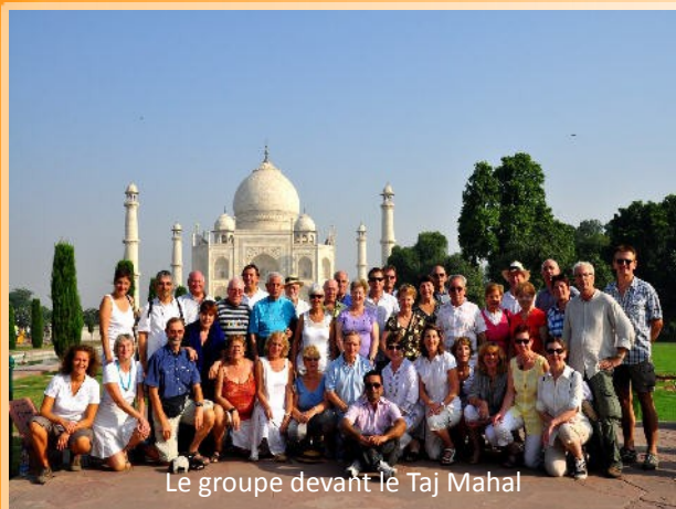
Le groupe devant le Taj Mahal

Dimanche 2 octobre : embarquement de 38 personnes, actifs et retraités, pour une destination de rêve : l'Inde, pays de contrastes, tant par la splendeur de ses palais, jardins, forts, temples, que par la précarité de vie de ses habitants.