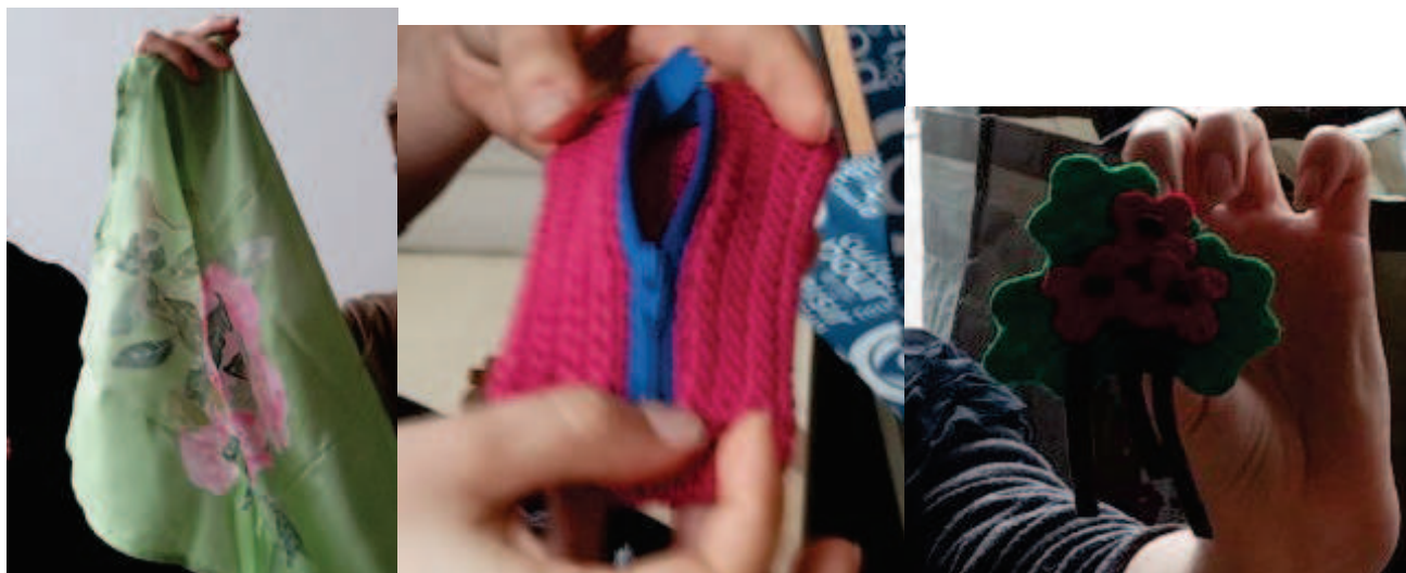
peinture sur soie, trousse au crochet, broche en feutrine

En décembre, les participantes ont organisé pour la deuxième fois "la remise des cadeaux de Noël" faits main (création ou customisation). C'est un moment privilégié car tout au long de l'année toutes les participantes ne sont pas disponibles tous les mardis. Cet événement est incontournable pour chacune des participantes qui en profite pour créer quelque chose qui plaira à coup sûr à une de ses camarades. C'est aussi l'occasion pour déjeuner toutes ensemble.