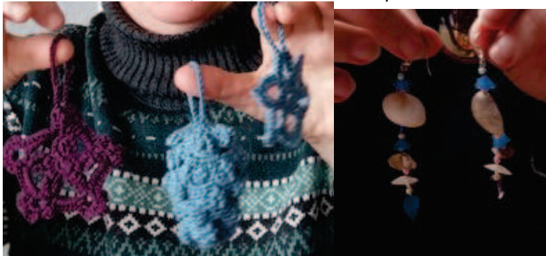
déco de Noël au crochet, boucle d'oreilles