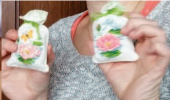
boîte à infusions, sachets de senteur au point de croix