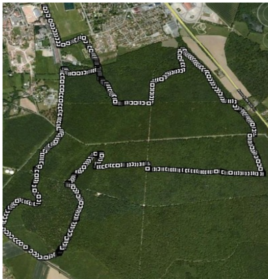
- parcours du 10km -