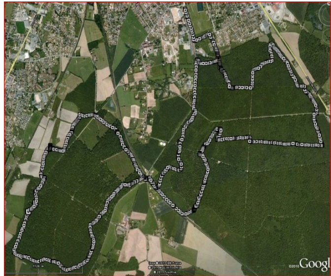
- parcours du 17km -