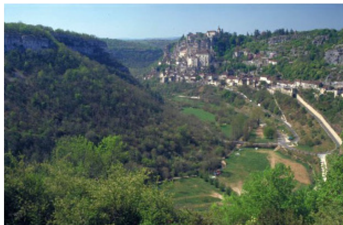
La vallée de l'Alzou et Rocamadour