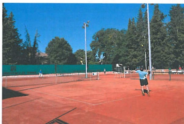
Installations de la Ligue de Provence de Tennis