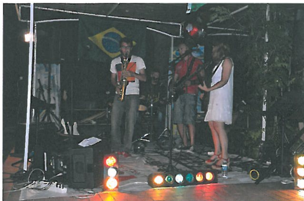
Concert du groupe de musique de l'ASCE 13 Cerema

De plus, le groupe de musique de l'ASCE13 Cerema s'est joint au challenge de tennis en effectuant un concert après le dîner du vendredi soir.