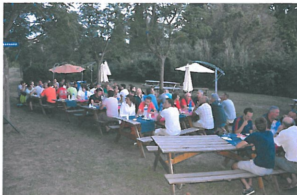
dîner en extérieur au restaurant administratif

Les challengers disposaient du restaurant administratif pour les petits déjeuners et les dîners. A midi, les participants déjeunaient au restaurant « les terrasses du country » du Country Club de tennis situé aux abords des installations sportives de la ligue de Provence de tennis.