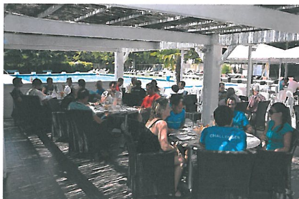
Déjeuner « les Terrasses du Country »