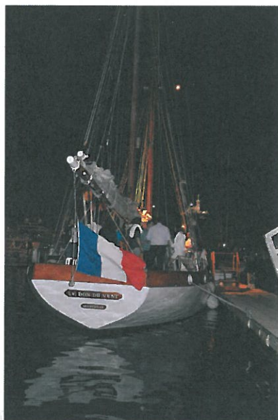
LE DON DU VENT

L'équipe d'organisation a souhaité clôturer ce challenge par une soirée originale le samedi soir. Un déplacement sur le vieux port de Marseille à bord du voilier en bois « le Don du Vent », navire classé d'Intérêt patrimonial par le Ministère de la Culture . Au programme, buffet antillais, suivi d'un concert rock et d'un DJ qui ont enflammé le vieux port.