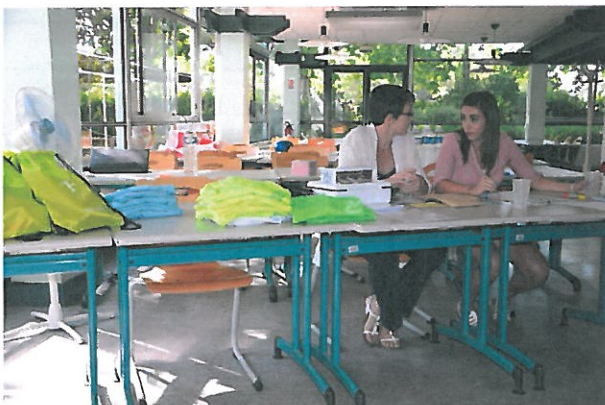
Stand accueil des participants

Un deuxième stand a permis la remise des cadeaux de bienvenue et la remise des clés des hébergements à tous les participants. 2 personnes de l'association ont réalisé cette tâche.