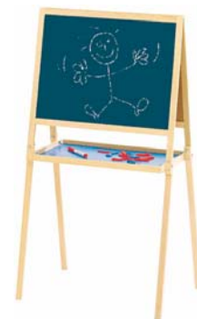
Tableau créatif en bois, 1 face craie et 1 face blanche magnétique. Dès 3 ans.